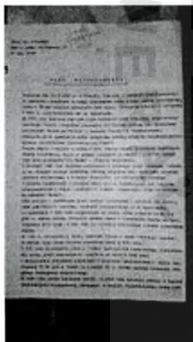
DSC_0110.JPG ~1.6 MB

Uprzejmie informujemy, że Instytut Pamięci Narodowej - KŚZpNP wywiązuje się z przepisów Rozporządzenia PE i Rady (UE) 2016/679 z 27 kwietnia 2016 r. w sprawie ochrony osób fizycznych w związku z przetwarzaniem danych osobowych i w sprawie swobodnego przepływu takich danych oraz uchylenia dyrektywy 95/46/WE (ogólne rozporządzenie o ochronie danych). Administratorem Pani/Pana danych osobowych jest Prezes IPN - KŚZpNP z siedzibą w Warszawie, adres: ul. Wołoska 7, 02-675 Warszawa. Pełna treść klauzuli informacyjnej jest opublikowana na stronie https://ipn.gov.pl/edukacja-1/dla-nauczycieli . W przypadku braku Pani/Pana zgody na otrzymywanie kolejnych maili o podobnej tematyce, należy wysłać odpowiedź na tego maila o treści: "nie wyrażam zgody na dalszą korespondencję ze strony IPN-KŚZpNP".