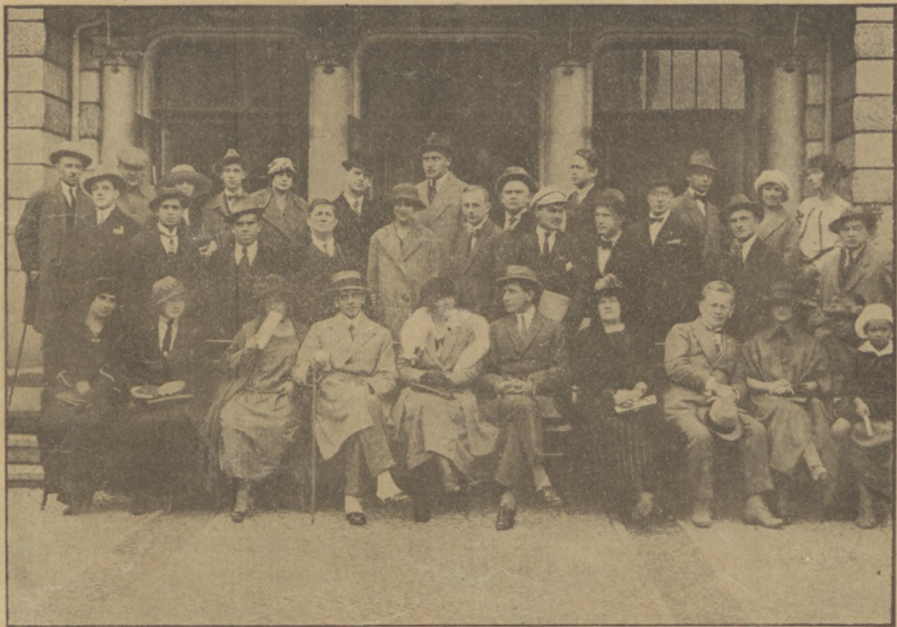
Zespół artystów Teatru Miejskiego.