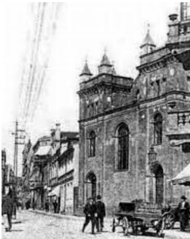
Synagoga w Grudziądz, początek XX w.

dekretów władz pruskich było nakazanie przyjmowania Żydom stałych nazwisk – do tej pory posługiwali się oni jedynie imieniem wraz z towarzyszącym mu imieniem ojca.