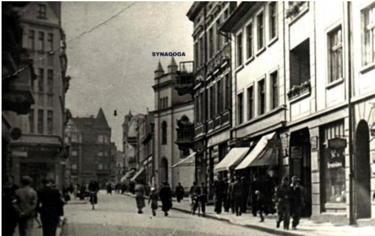
Synagoga w Grudziądz, lata 30. XX w., fot. H. Gąsiorowski, ze zbiorów Z. Zawadzkiego.

dekretów władz pruskich było nakazanie przyjmowania Żydom stałych nazwisk – do tej pory posługiwali się oni jedynie imieniem wraz z towarzyszącym mu imieniem ojca.