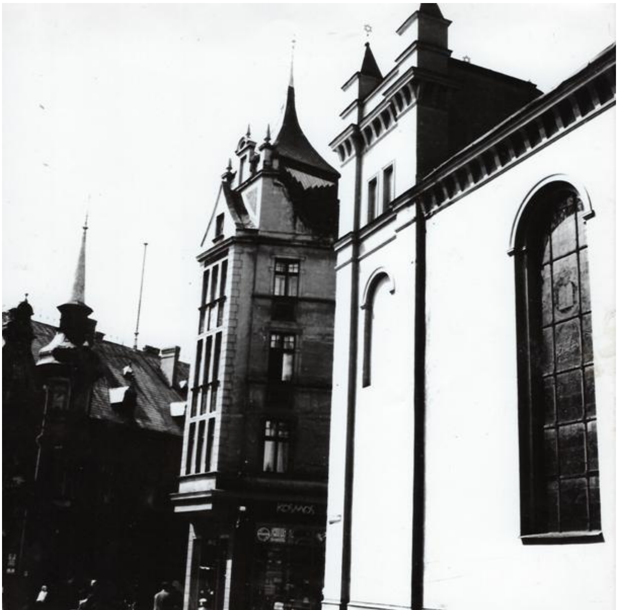
Synagoga w Grudziądzu 1938 r.

pozwolił im na pozostanie i osiedlenie się w mieście. Przybywający do Grudziądza w XVIII wieku Żydzi zobowiązani byli do płacenia podatków, z których utrzymywano rabina, zarząd synagogi, prowadzono działania o charakterze dobroczynnym. Przybywający do pruskich miast Żydzi zobligowani byli także do płacenia podatku świeczkowego pobieranego od ilości wykorzystanych podczas uroczystości religijnych świec woskowych lub lojowych. Będąc jedną z najbardziej represjonowanych społeczności w miastach zmuszeni byli uiszczać również tzw. „biletowe” – opłatę za możliwość pobytu w miastach objętych wcześniej prawem de non tolerandis iudaeis , a także „koszerne” oraz podatek od uboju rytualnego przewidzianego prawem religijnym. Ustanowione w 1797 roku Generalne urządzenie Żydów w prowincjach Prus Południowych i Nowoschodnich regulowało wszystkie przejawy życia religijnego, gospodarczego i społecznego ludności żydowskiej. Jednym z pierwszych