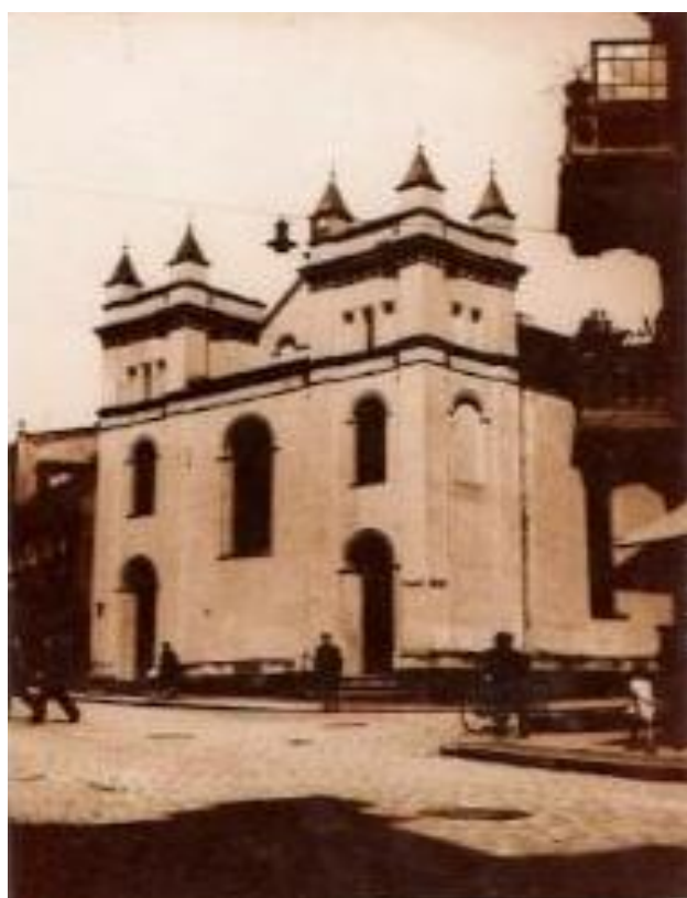
Synagoga w Grudziądz, lata 20.-30. XX w., fot. nieznany, ze zbiorów Z. Zawadzkiego.

Druga połowa XIX wieku to czas stopniowego awansu społecznego przedstawicieli ludności żydowskiej, którzy znajdowali oparcie w praktykowaniu judaizmu w szeregach gminy wyznaniowej utrzymującej synagogę, cmentarz oraz budynki o charakterze oświatowym i dobroczynnym. Postępująca emancypacja doprowadziła do sytuacji, w której żydowscy mieszkańcy miast pruskich stali się częścią kultury niemieckiej, odnajdując w niej atrakcyjne dla siebie modele obyczajowe, kulturowe i społeczne przy całkowitym zachowaniu odrębności religijnej. Patent