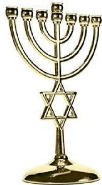
Menora z Gwiazdą Dawida

Ziemia chełmińska po pierwszym rozbiorze w 1772 roku znalazła się pod panowaniem Fryderyka II Wielkiego, który traktując Żydów w sposób merkantylny, upatrywał w ich osadnictwie możliwość osłabienia ekonomicznego kupców niemieckich. Mimo tej postawy władz, przybyło do Grudziądza w latach osiemdziesiątych XVIII wieku około 20-30 rodzin, których status majątkowy (posiadanie kapitału o wysokości co najmniej tysiąca talarów)