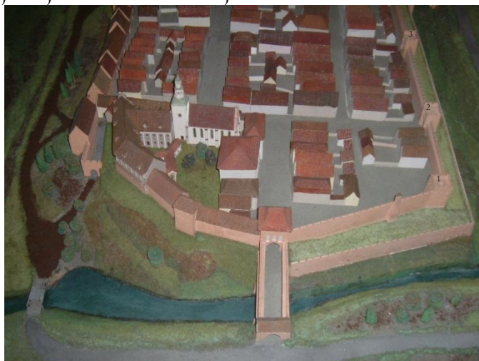
Baszta Katowska, Baszta Złodziejska i Brama Boczna na makiecie Grudziądza w Muzeum im. ks. dr. Władysława Łęgi w Grudziądzu.

W narożniku południowo-wschodnim Baszta Katowska, dalej na północ między Basztą Katowską a Bramą Bocznią widoczna Baszta Złodziejska. Lokalizacja Baszty Złodziejskiej na makiecie nie jest dokładna.