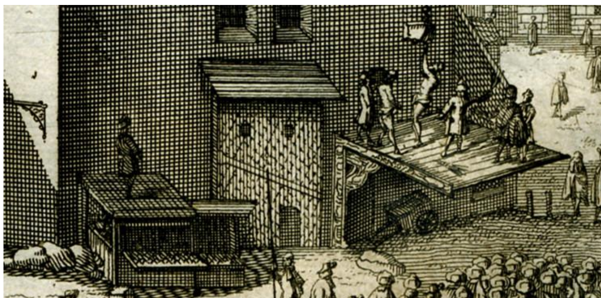
Pręgierz przyścienny.

Zachowany pręgierz na Baszcie Katowskiej był przyczyną upadku pomysłu lokalizacji tam pomnika św. Chrystiana biskupa misyjnego Prus,