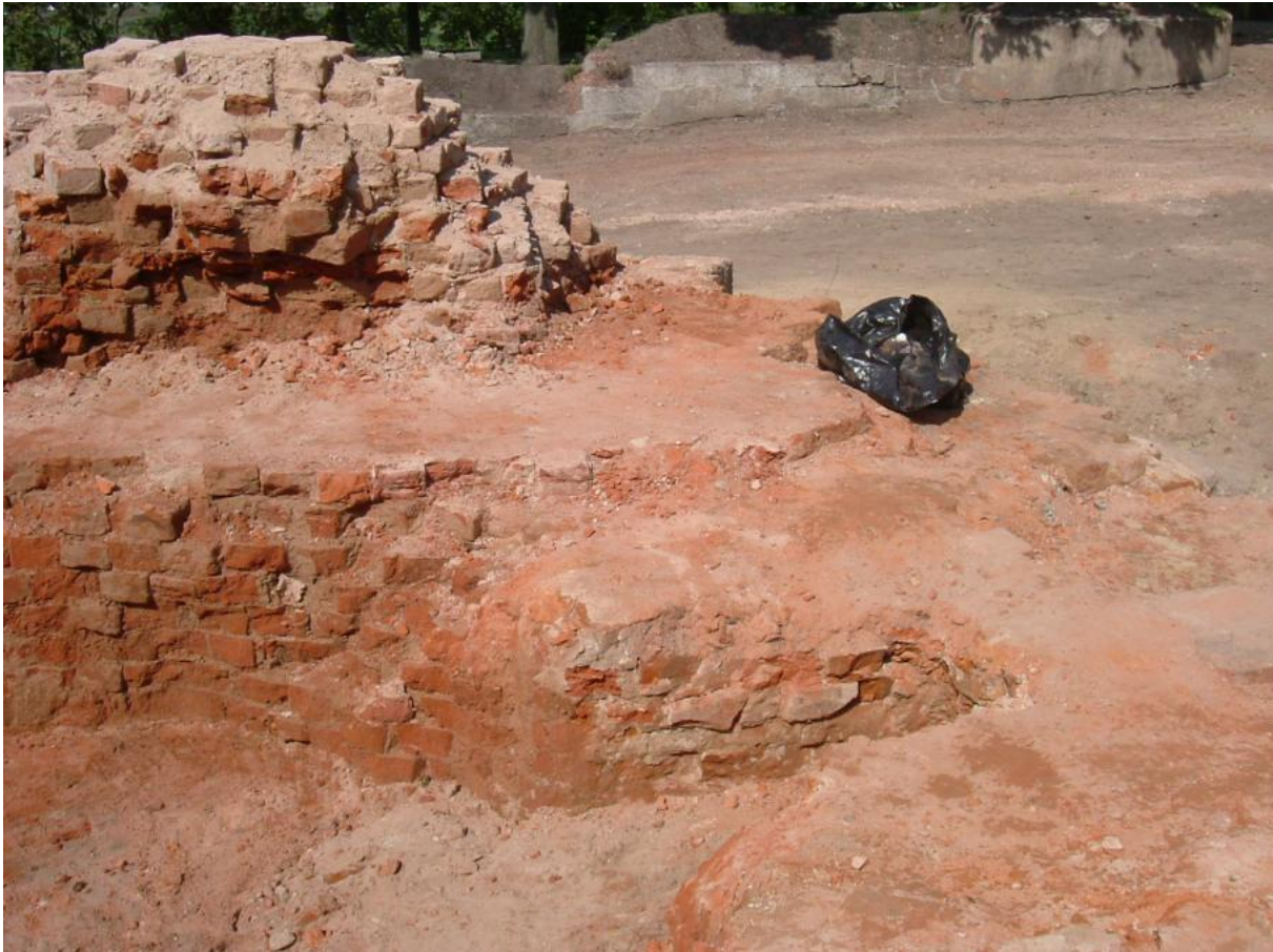
Relikt lochu w wieży Klimek. Widok od strony północnej. Stan w 2006 r.

ziemi chełmińskiej. Dane poglądowe: średnica wieży ok. 9 m, wysokość lochu ok. 1,5 m.