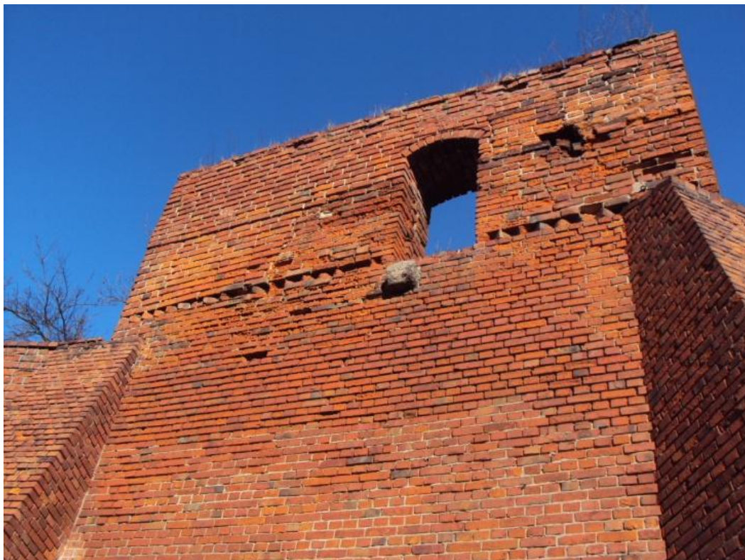
Grudziądz. Pozostałości Baszty Katowskiej z pręgierzem. Stan z ok. 2010 r.

na Baszcie Więziennej w Gdańsku, czyli drzwi katowskie oraz na poziomie ich progu pręgierz 14 .