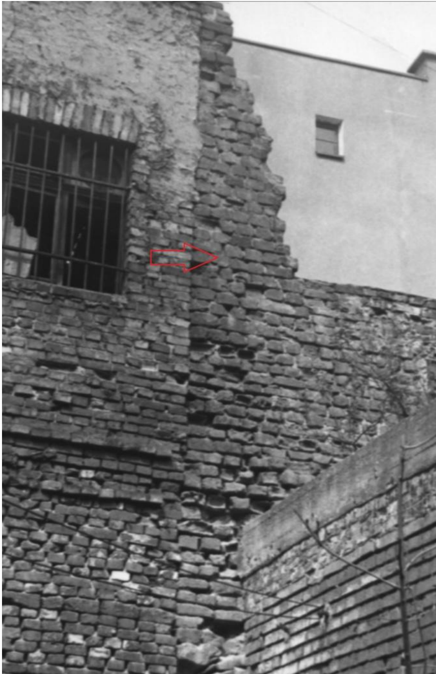
Pozostałości Baszty Więziennej. Stan z ok. 1989 r.

Do lat 90. XX w. czytelne były też relikty Baszty Więziennej, przy ul. Murowej, na odcinku południowym. Relikt baszty zaznaczony strzałką. Zdjęcie z końca lat 80. XX w.