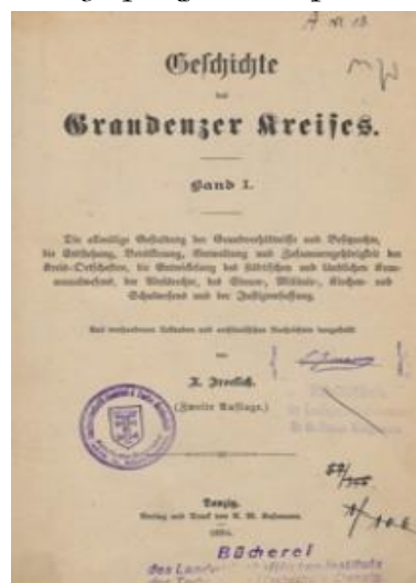
Okladka tomu I książki X. Froelicha, Geschichte des graudenzers Kreises .

b. Miejska samowola, Wettartikel, gerichtliche Beizucht , opłaty sądowe. Prawo zwyczajowe mia-