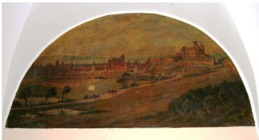
Panorama Grudziądza w średniowieczu. Obraz Wilhelma Burzy w holu II Liceum Ogólnokształcącego im. Króla Jana III Sobieskiego. Fot. M. Szajerka.

W narożniku południowo-wschodnim Baszta Katowska, dalej na północ między Basztą Katowską a Bramą Bocznią widoczna Baszta Złodziejska. Lokalizacja Baszty Złodziejskiej na makiecie nie jest dokładna.