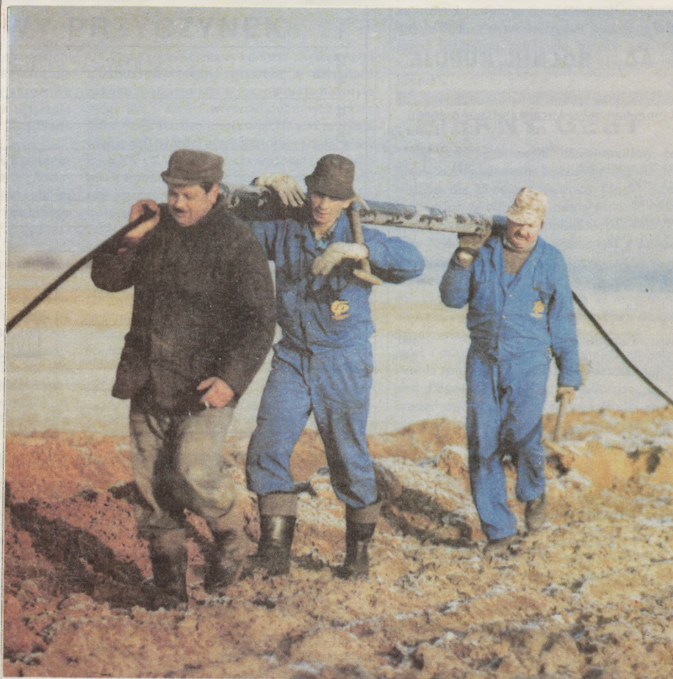
Pracownicy Telekomunikacji Polskiej i mieszkańcy Dochanowa pracowali ramię w ramię przy układaniu kabla. Na zdjęciu - przeciąganie rury, mającej stanowić osłonę kabla przy przejściu pod boczną drogą.

• Bydgoszcz. W środę, 30 grudnia Zarząd Wojewódzki PCK w Bydgoszczy ma podjąć decyzję dotyczącą kontynuacji, bądź likwidacji wydawania darmowych zup dla potrzebujących. PCK-owska stołówka w Zninie otwarta 1 XII działała dopiero miesiąc. (ax)