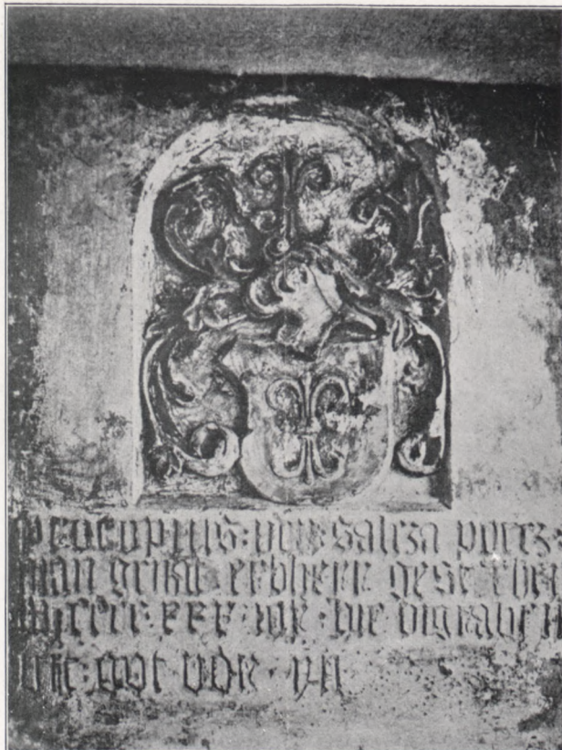
Grabstein des Sörlitzer Bürgermeisters Johannes Frauenburg († 1495) in der Sörlitzer Klosterkirche