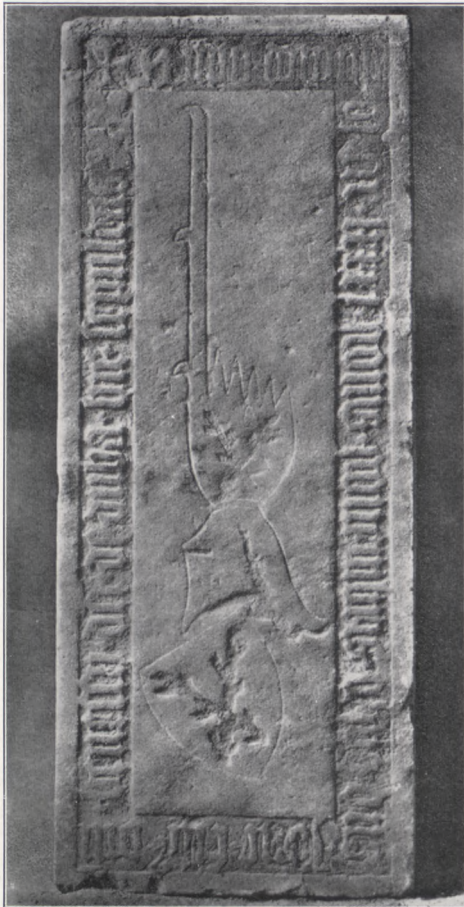
Grabstein des Jone von der Duba († 1381) in der Sörlitzer Franziskanerkirche