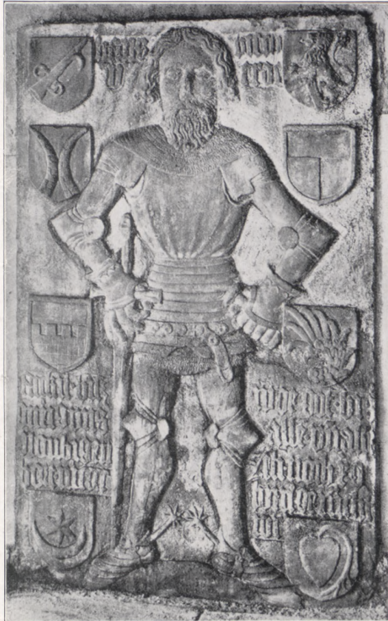
Ein Bischofswerderscher Grabstein in der Kirche zu Ebersbach bei Sörlitz