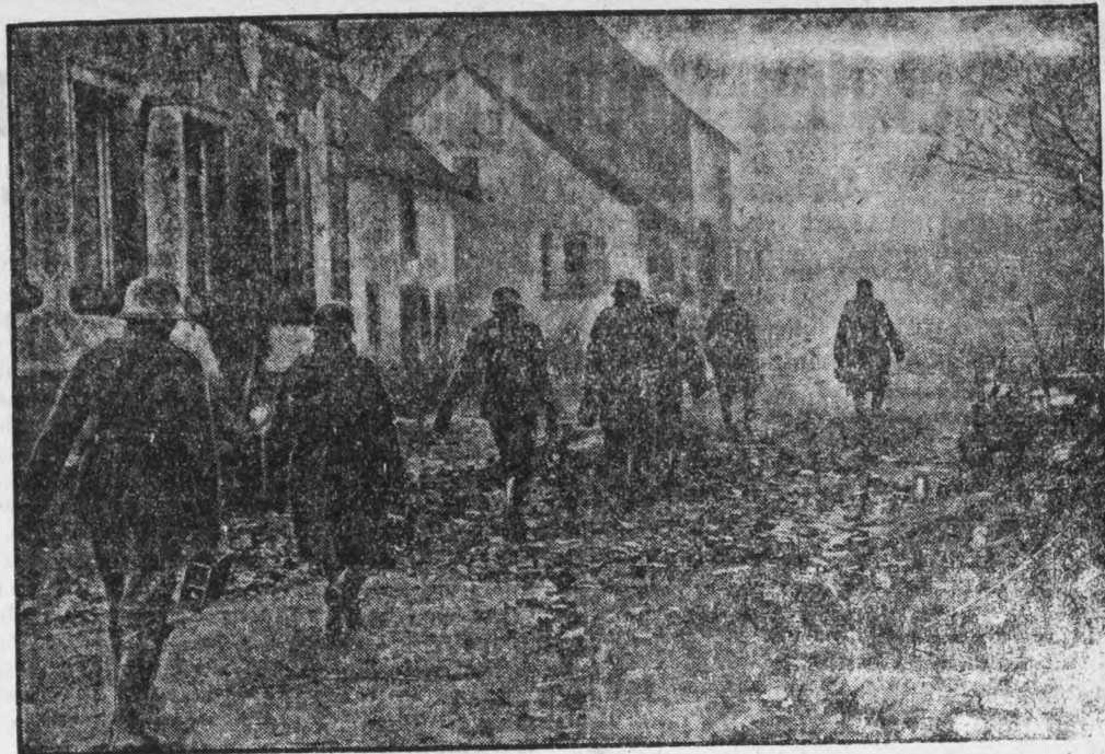
Im Morgennebel nach vorn! MG-Munition wird vorgebracht. (PK-Weitbild, M.)