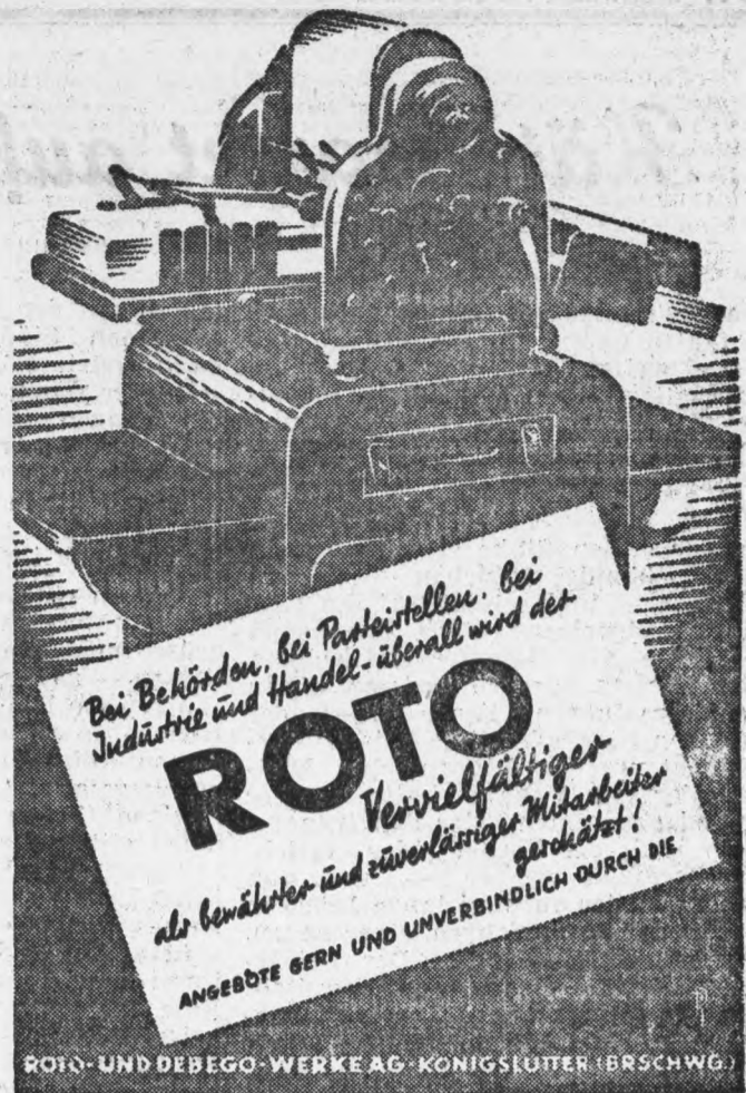
ROTO- UND DEBEGO-WERKE AG. KONIGSLEUTER (BRISCHWIG.)