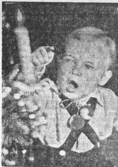
Bald ist Weihnachten

Jahren und mehr war anstelle des damals erst aufkommenden Lamettas ein Gehänge von Papierrosetten üblich, das sich in Ketten um den Baum herumzog. Endlich aber kam aus Thüringen zu