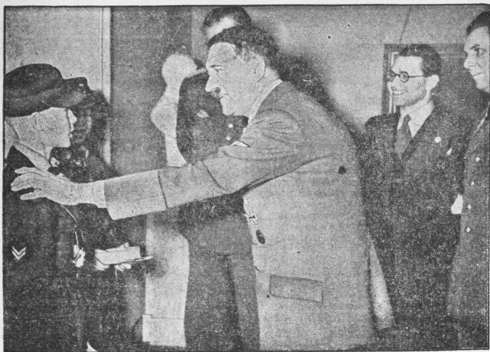
Pimpfe sammelten beim Führer. Zwei Angehörige des Deutschen Jungvolks hatten Glück. Sie sammelten für die 3. Reichsstrassensammlung des Kriegs-Winterhilfswerkes des deutschen Volkes beim Führer. Hinter dem Führer Reichsleiter Bouhler und Brigadeführer Bormann.