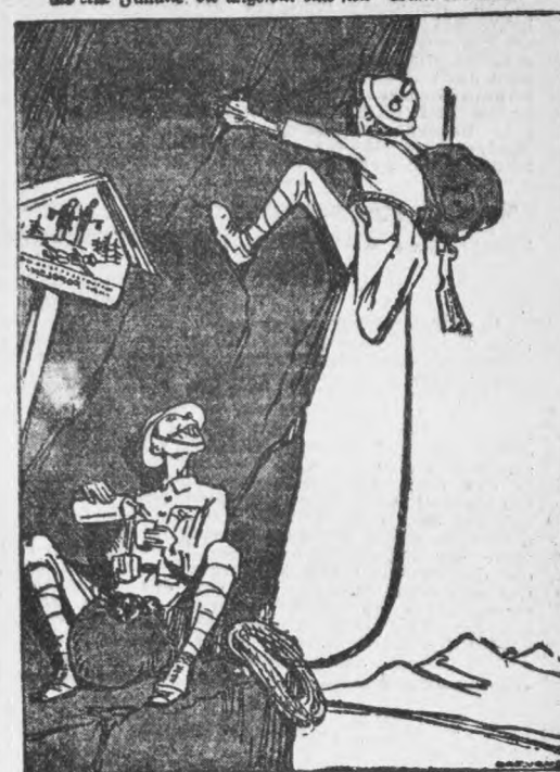
„Es ist 5 Uhr, my boy, um diese Zeit pflegt ein Engländer seinen Tee zu sich zu nehmen!“ (Aus dem „Klabberbatsch“).

Der waghalsige Kriegsmilitär bezeichnete England und Frankreich als eine Familie, die angelehnt eine Welt-Wand erklimmt.