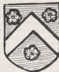
von 1664 an.