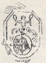
Carl Henrich Rote Dernbach 1689