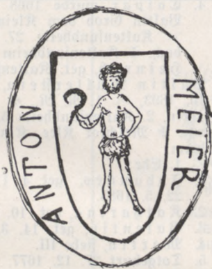
1645 bis 1659 (auch f. Söhne nach 1660).