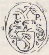
Tobias Roth Forstmeister Erbenhausen 1702