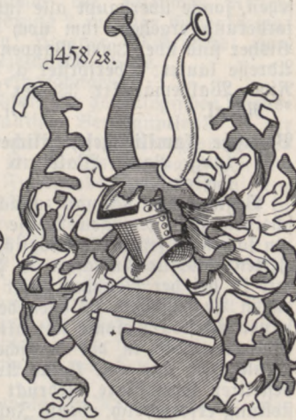
• Beil •

1458. 1. 7. 1928. Beil aus Schiepzig, Gröbers und Lettewitz (Saalekreis). Antragsteller: Dr. Walter B. in Frankfurt a. M. In blauem Schilde mit silbernem, linkem Schräghaupt ein silbernes schrägrechtsgestelltes Beil. Auf dem blau-silbern bewulsteten Helme mit blau-silberner Decke ein blaues und ein silbernes Büfelfhorn.