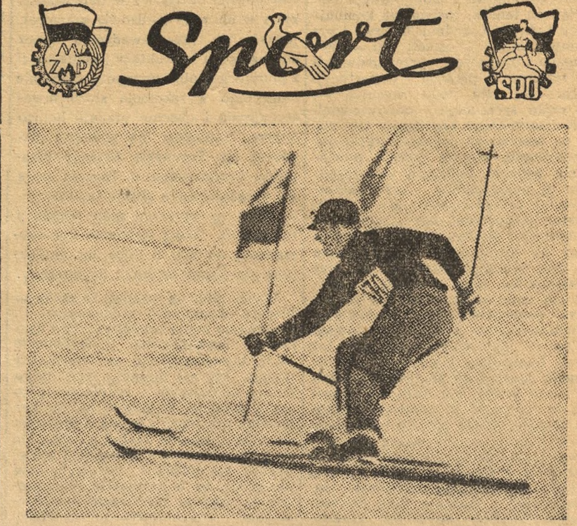
W górach wysoka pokrywa śnieżna pozwala nie tylko na masową turystykę narciarską, ale i na zawody. Na zdjęciu: mijanie bramek w slalomie.

Dnia 28. XII. 1951 r. Pomorska Fabryka Taśm i Pasów im. Małgorzaty Fornalskiej w Bydgoszczy wykonała roczny plan produkcji w 100,2 proc.