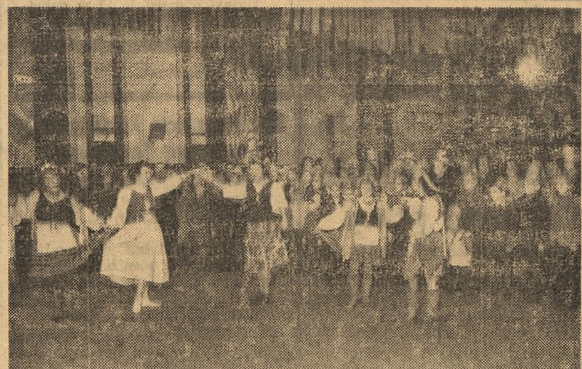
W wielkiej imprezie noworocznej, zorganizowanej przez Towarzystwo Przyjaciół Dzieci w gmachu szkół TPD w Bydgoszczy, wzięli udział ogółem ponad 6000 dzieci...