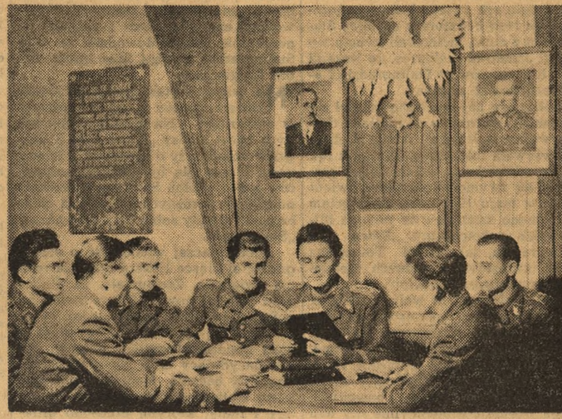
Nowe kadry przyszłych oficerów Ludowego Wojska Polskiego, to synowie robotników, chłopów i inteligencji pracującej.