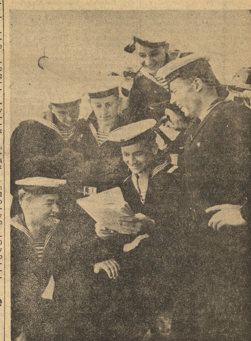
NA ZDJĘCIU: Grupa marynarzy Morskich Sił Zbrojnych ZSRR w czasie odpoczynku.