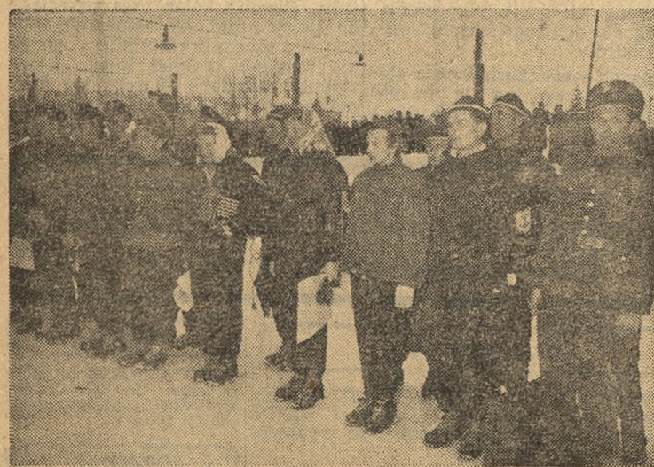
W Zimowej Spartakiadzie Wojska Polskiego wzięło udział wielu czołowych zawodników. Na zdjęciu widzimy zawodników, którzy otrzymali nagrody za zdobycie czołowych miejsc w Spartakiadzie.