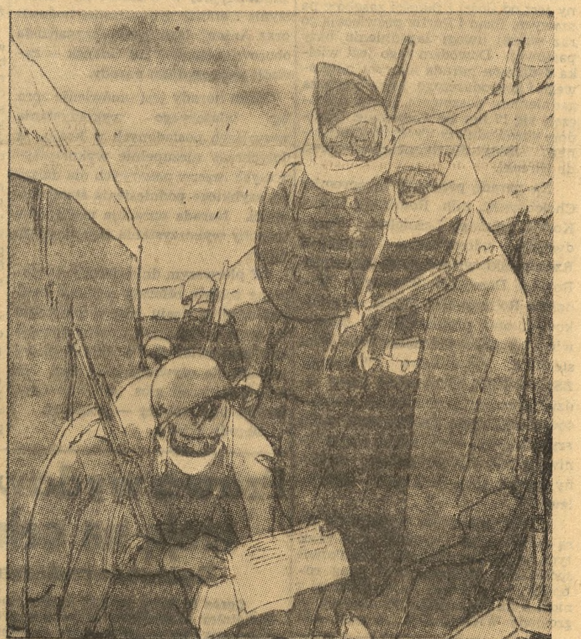
— Amerykańscy przedstawiciele w Panmunđon stawiają siebie samych w głupiej sytuacji, a nas — w sytuacji bez wyjścia.