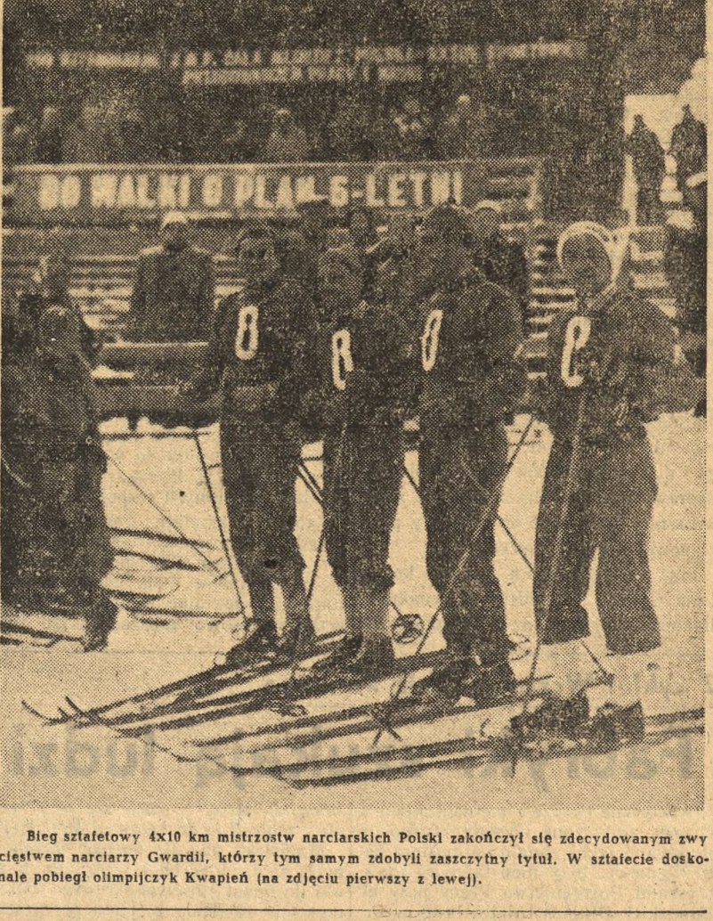
Bieg sztafetowy 4x10 km mistrzostw narciarskich Polski zakończył się zwycięstwem Gwardii...