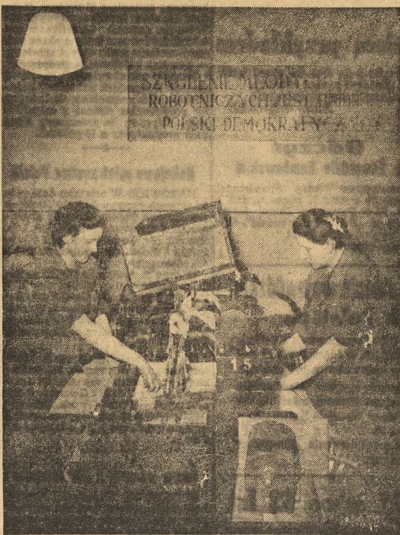
Przy ZPB im. J. Stalina w Łodzi prowadzony jest dział szkolenia instruktorów w zakresie metody inż. Kowalowa. Na szkolenie prowadzone przez przewodników pracy przychodzi także tkacki z innych zakładów przemysłu bawełnianego.