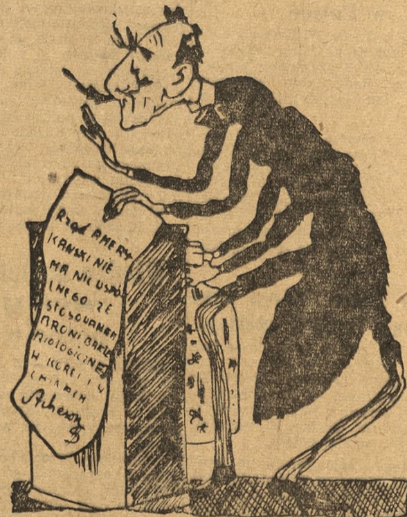
WBREW OCZYWISTYM DOWODOM RZĄD USA USILUJE WYPRZEC SIĘ SWOICH ZBRODNI, Rys. Kukryniksz