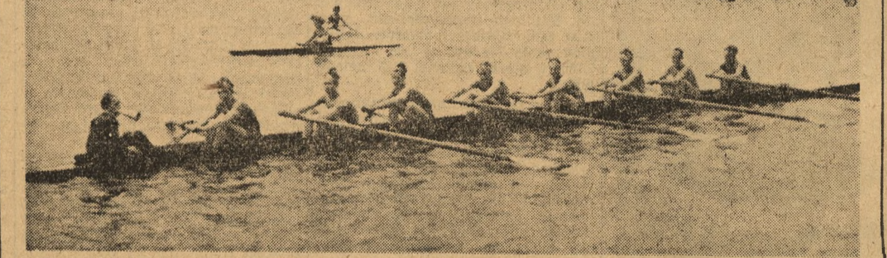
Ub. niedzieli na torze regatowym w Łęgowie odbyły się wioślarskie mistrzostwa Polski ZS Kolejark. W biegu Osemek zwyciężyła osada Bydgoskiego Kolejark, którą widzimy na zdjęciu w chwili udawania się na start.