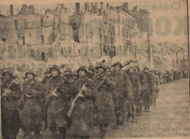
Dnia 17 stycznia 1945 roku bohaterkie wojska Pierwszego Białoruskiego Frontu, dowodzone przez marszałka Żukowa — i okryta sławą I Armia WP pod dowództwem gen. Popiawskiego — wyzwoliły Warszawę spod jarzma hitlerowskiego okupanta. — Na zdjęciu: do wolnej Warszawy wkrocza Wojsko Polskie.

MOSKWA (PAP). Agencja TASS podaje z Kairu: Jak donosi dziennik „Al-Ahram”, wzmocnione oddziały wojsk brytyjskich usiłowały po raz trzeci zająć Tel El-Kebir, ostrzelały to miasto i zniszczyły kilka domów mieszkalnych. Ludność miasta, partyzanci i policja stawili silny opór wojskom brytyjskim i zmusiły je do odwrotu.