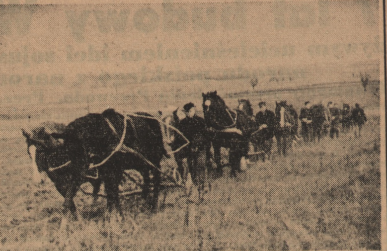
W styczniu rb. trzydziestu chłopów z gromady Postolin w woj. gdańskim zorganizowało zespół uprawowy. Dzięki łagodnej zimie zespół ten przystąpił już do pierwszych wspólnych orki. Na zdjęciu: Chłopi zrzeszeni w zespole uprawowym podczas orki.