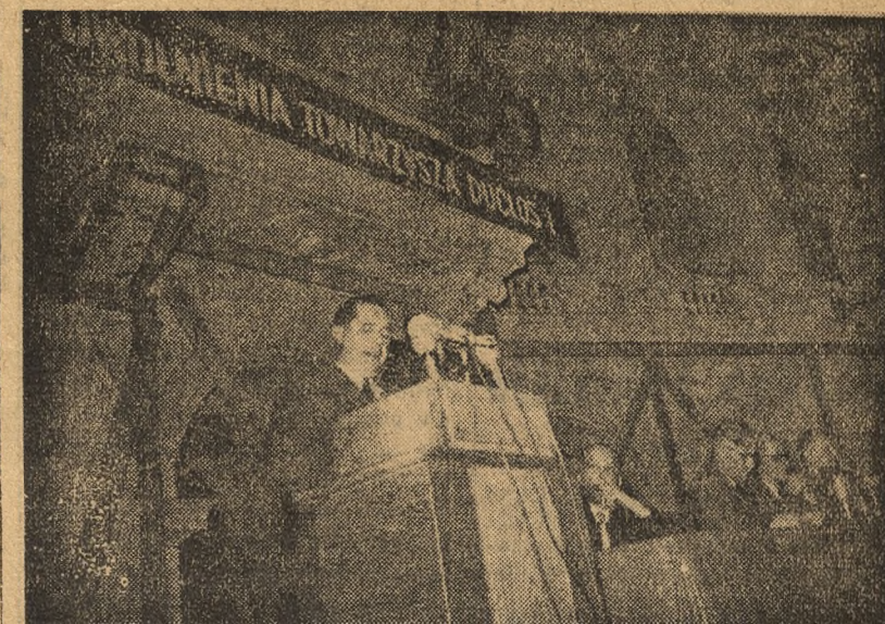
W dniu 29 maja br. odbył się w Politechnice Warszawskiej wielki wiec protestacyjny przeciwko bezprawnemu aresztowaniu Jacques Duclos, sekretarza Komunistycznej Partii Francji. Na wiecu tym ludność Warszawy żądała natychmiastowego uwolnienia aresztowanego.

O tej samej porze odbywały się obławy policyjne w lokalach partii komunistycznej w Lyonie, Marsylii, Bordeaux, Nicei, Grenoble, Clermont Ferrand, La Rochelle itd. Okoliczności tych operacji policyjnych przypominały wszędzie sceny, których świadkiem był naród francuski podczas okupacji hitlerowskiej.