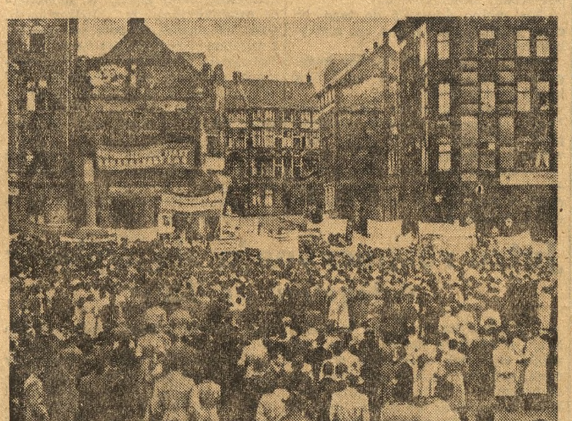
W całym Niemczech Zachodnich narasta fala demonstracji pod hasłem walki o traktat pokoju z Niemcami i przeciwko „układowi ogólnemu”. NA ZDJĘCIU: Potężny wiec protestacyjny w Essen przeciwko „układowi ogólnemu”.