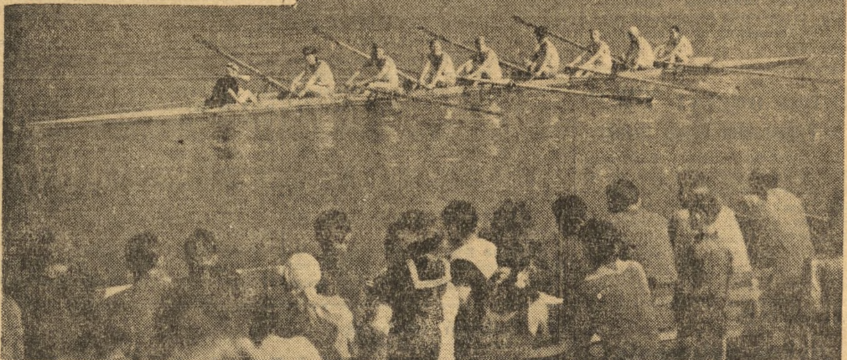
Osada ósemki kl. III OWKS (Bydgoszcz), która zwyciężyła w tej konkurencji na regatach eliminacyjnych w Kruszwicy, defilują przed trybunami.

Projektowany stadion mieścić się będzie na terenie zamkniętym od połubnia ulicą Gen. Bema oraz od wschodu przebiegającą Al. 700-lecia. Użytkowanie stadionu właśnie w tym miejscu pocliagne