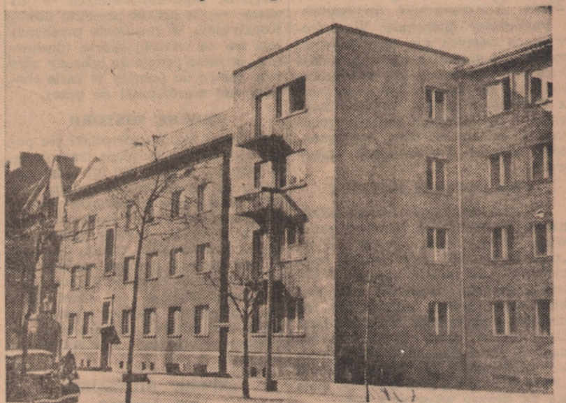
W Bydgoszczy znać rytm pokojowej budowy ostatnio dom na rogu ul. 24 Stycznia i Zamojskiego.