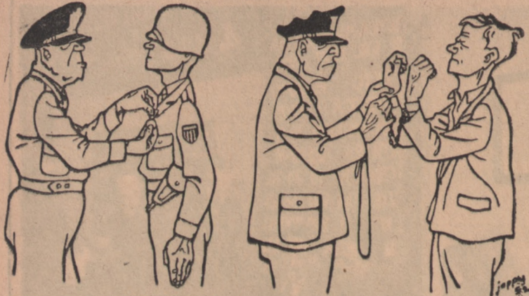
Wyróżnienie amerykańskiego żołnierza za walkę z faszyzmem... W roku 1943 odznaczeniem brązowym