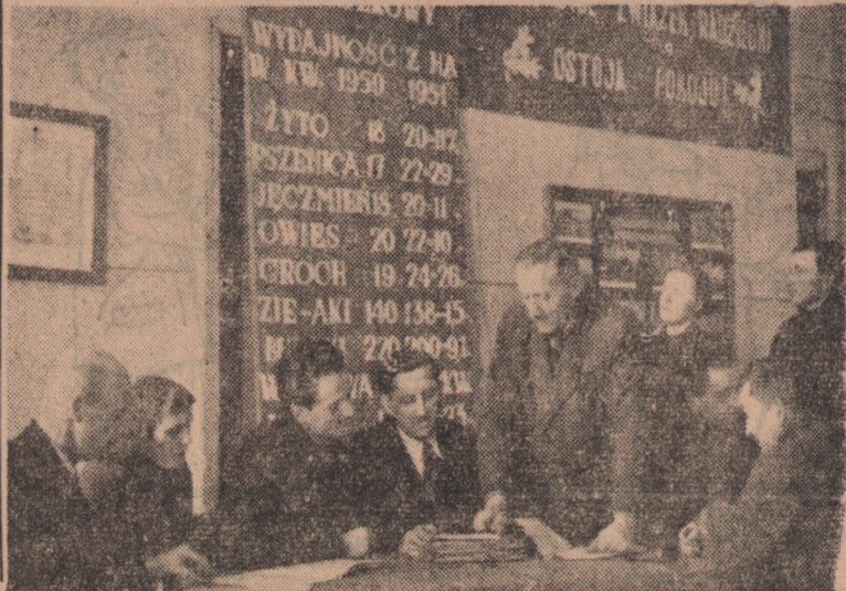
Opracowanie planu produkcji w spółdzielniach produkcyjnych jest podstawą planowej gospodarki spółdzielni i jej współpracy z Państwowym Ośrodkiem Maszynowym. Na zdjęciu: Zarząd spółdzielni produkcyjnej „Zdobycz Chłopska” w Kokoszkowych w woj. gdańskim, przy współudziale przedstawicieli POM-u i Powiatowej Rady Narodowej, opracowuje plan produkcyjny na rok bieżący.