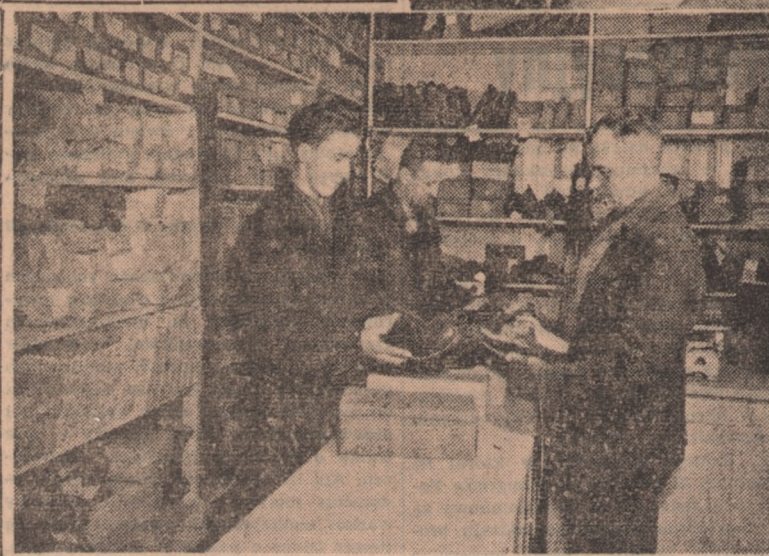
Sklepy Gminnej Spółdzielni „Samopomoc Chłopska” zaopatrzone w najróżnorodniejsze towary ułatwiają mieszkańcom wsi nabycie niezbędnych artykułów bez uciążliwej wędrowki do miasta. Na zdjęciu: Fragment sklepu GS w Strzałkowie.

Komunistyczna Partia Grecji i Grecka Partia Agrarna zzywają naród grecki i armię do stałej czujności i gotowości, by drogą przeprowadzenia ogólnoludowej