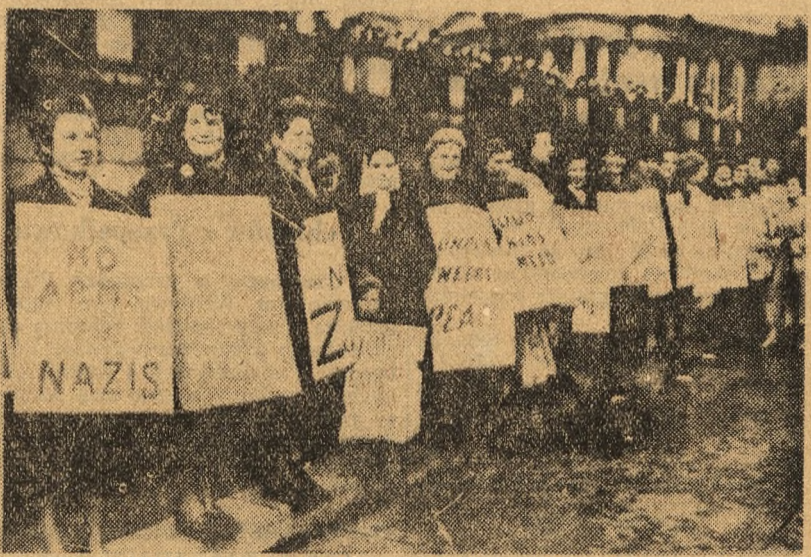
W Anglii z każdym dniem rośnie na ulice ruch obrony pokoju. W wyniku wojennej polityki rządowej mnożą się manifestacje pokojowe na ulicach miast angielskich. NA ZDJĘCIU: Kobiety brytyjskie manifestują na ulicach Londynu. Hasła głószą: „Nie dawać broni hitlerowcom”, „Londyn żąda pokoju”, „Lud angielski nie zapominał narodów, ani polaków”.