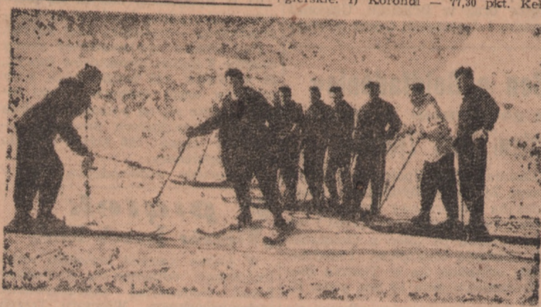
18 bokserów odpoczywa w najpiękniejszym ośrodku wypoczynkowym...