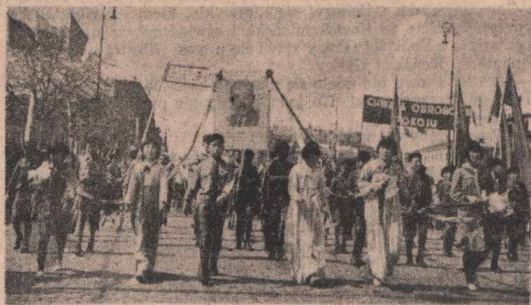
Dzieci koreańskie w czasie defilady