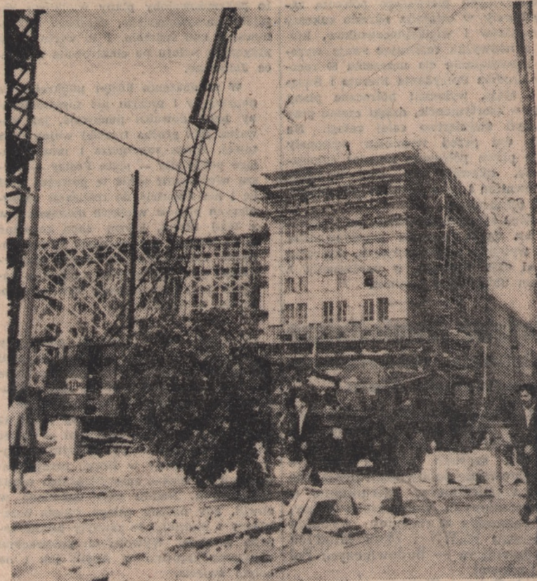
Miejskie Przedsiębiorstwo Ogrodnicze przystąpiło w dniu 26 czerwca br. do sadzenia pierwszych drzew na placu Marszałkowskiej Dzielnicy Mieszkaniowej.

Liczne wartościowe zobowiązania podjęli również pracownicy pionu technicznego Zakładów Wytórczych Sprzętu Teletechnicznego w Bydgoszczy.