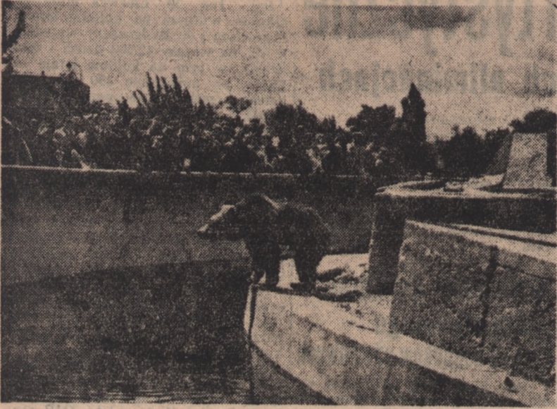
Niedźwiedzie na wybiegu przy trasie W-Z czują się doskonale.