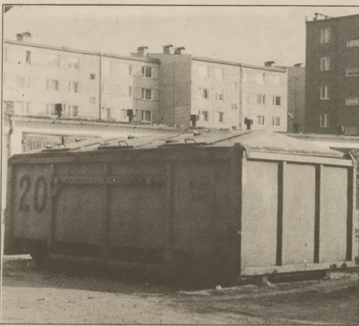
Kontener na śmieci, stojący na osiedlu mieszkaniowym w Żninie.

Przedsiębiorstwo opiekuje się zielenią miejską, ale na każdą pracę dostaje zlecenie podpisywane przez burmistrza: - Obetnijcie tu i tu gałęzie, zacznijcie