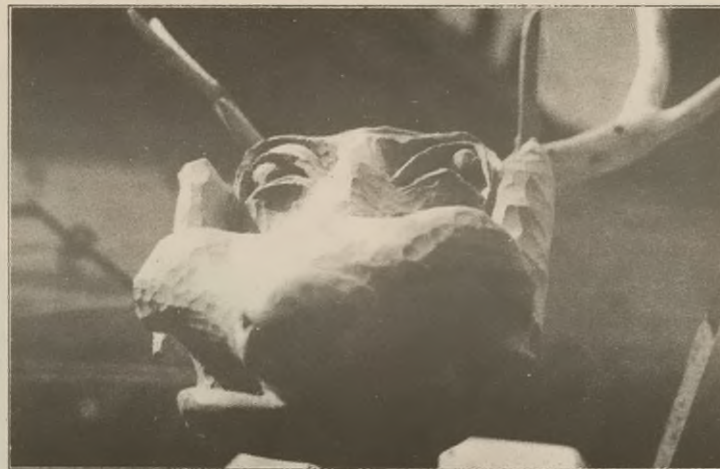
Łoś z cyklu "Trofea myśliwskie" (ze zbiorów prywatnych)

Ekspozycja nie straciłaby zapewne nic gdyby nie pokazano małych,