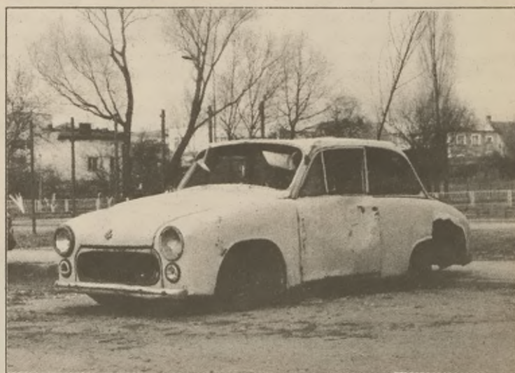
O zdemolowanej syrence na parkingu w Żninie piszemy na str. 2

Radni na sesji zdecydują o udzieleniu absolutorium zarządowi za ubiegły rok. Razem z budżetem zostanie uchwalony plan przychodów i rozchodów Gminnego Funduszu Ochrony Środowiska i Gospodarki Wodnej. Obecnie jest to jedyny funkcjonujący fundusz celowy poza budżetem. (sk)