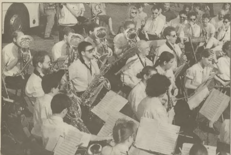
Orkiestra "Sirena" z Hooge Mierde