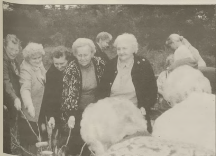
Członkowie Klubu Seniora w Łabiszynie przy ognisku.