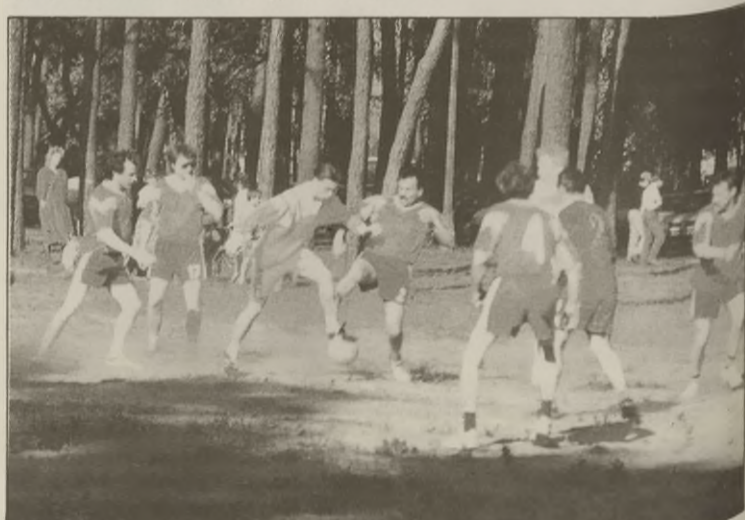
Towarzyski mecz piłkarski pomiędzy zaprzyjaźnionymi Holendrami i przedstawicielami Janowca