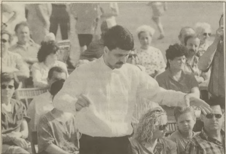
Dyrygent zespołu "Sirena" z Hooge Mierde