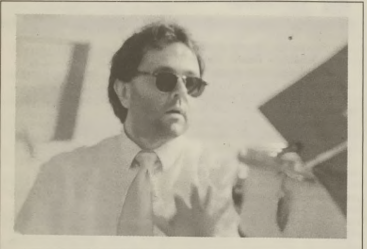
Dyrygent holenderskiego zespołu werblistów "En Drumband"