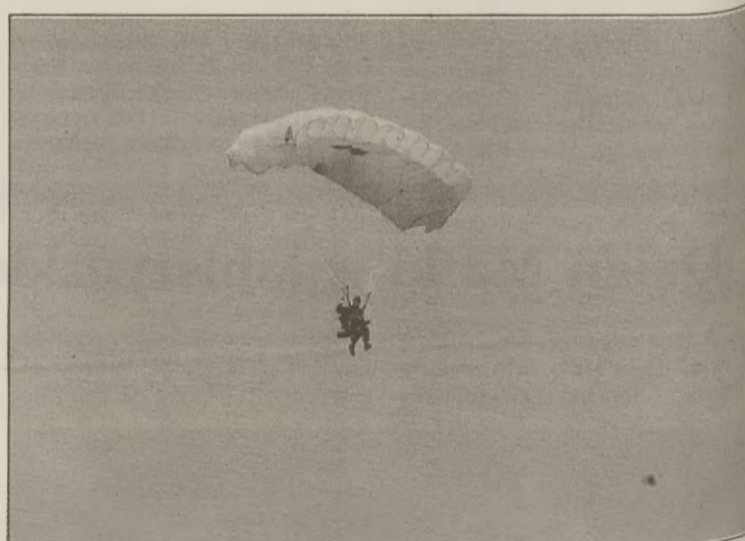
Skoczek spadochronowy chwilę przed lądowaniem