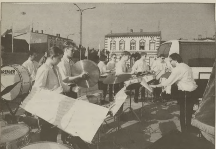
Występ zespołu "Eu Drumband"