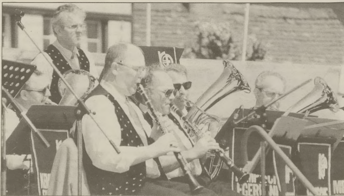
Muzycy z "Kempische Egerland Freunde" z Bladel w Holandii w trakcie koncertu.