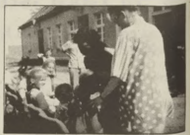
Mamy odnajdują swoje pociechy.

W Smoguleckiej Wsi 1 czerwca przy pięknej, słonecznej pogodzie wypoczywało i świetnie bawiło się około 130 dzieci. Wśród wielu zabaw i kon-