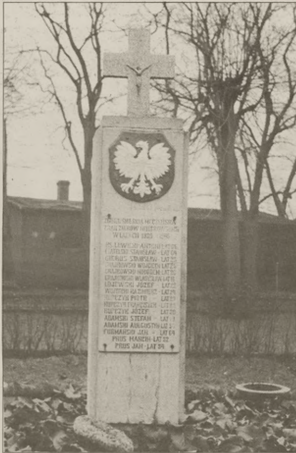
fot. Gościeszyn - pomnik ku czci pomordowanych w czasie II wojny światowej.

Akcja tygodnika Pałuki , stowarzyszenia Wielkopolska- Kubań i Fundacji IDEE