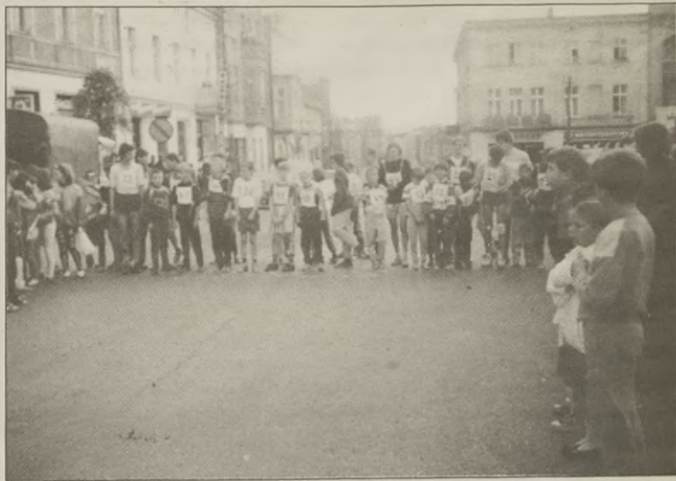
Start do biegu ulicznego

Następnego dnia w kościele pw. NMP odprawiona została uroczysta msza św. w intencji rolników z udziałem orkiestry OSP. Po niej w Kcyńskim Ośrodku Kultury odbyło się spot-