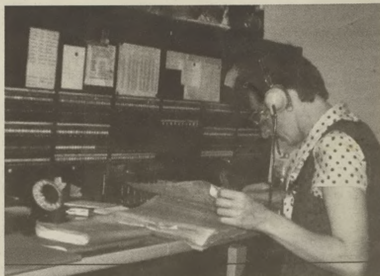
W Żnińskiej centrali.