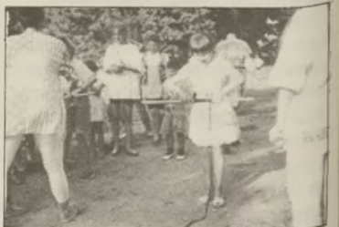
Dzieci podczas zabaw sprawnościowych

W Smoguleckiej Wsi 1 czerwca przy pięknej, słonecznej pogodzie wypoczywało i świetnie bawiło się około 130 dzieci. Wśród wielu zabaw i kon-