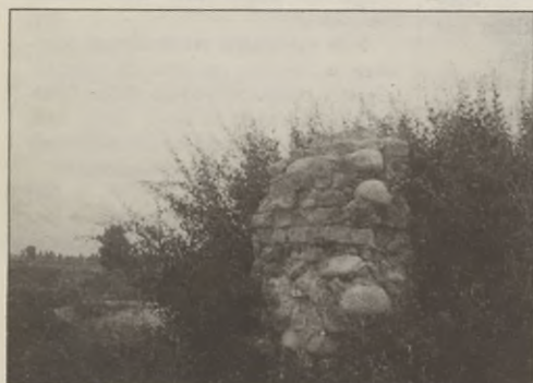
Tyle zostało po kościele.

ty sytuacją. Mówi, że teraz po prostu nie ma gospodarzy. Ani Zarząd ani Rada Miejska nie mają nic do gadania. Karty wędkarskie sprzedają Zakłady Rybackie i na tym się kończy ich rola. Do pilnowania porządku nad brzegami - nie poczuwa się nikt. Ziemia jest wykupiona i w związku z tym też nie można ingerować, ot - choćby wyrzucić rupiecie znajdujące się wo-