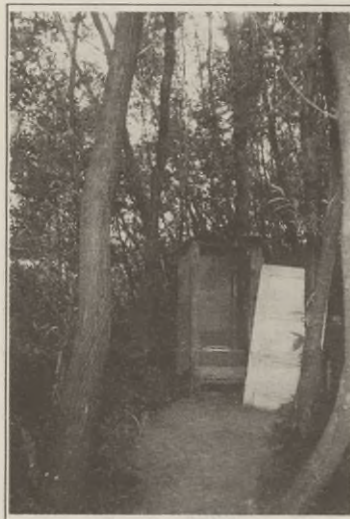
Ślawojka nad brzegiem