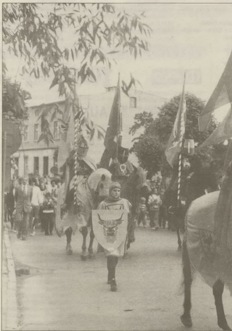
Przemarsz ze Starego Barcina.