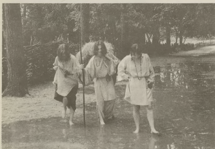
Cerowanie i lepienie