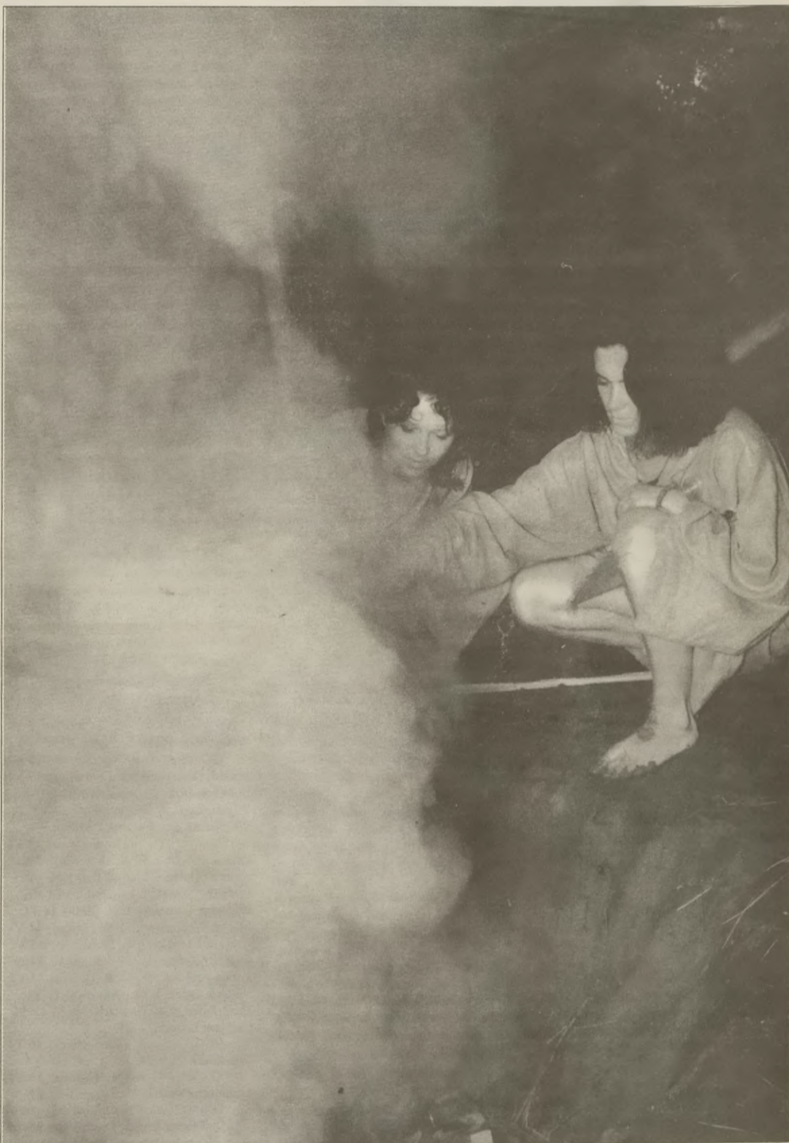
Wypalanie naczyń glinianych.

JACEK MIELCARZEWICZ pozostałe zdjęcia - na stronie 6.