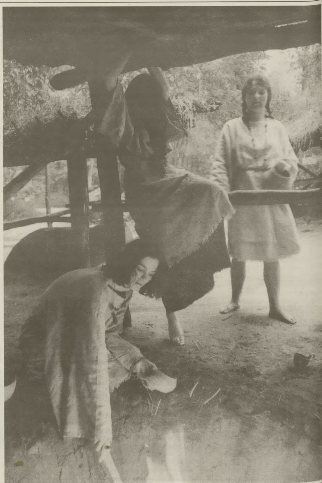
Wypalanie naczyń glinianych