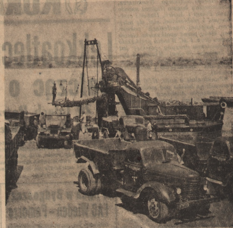
Załoga warszawskiej pogłębiarki „Perla” zobowiązała się dla uczczenia ósmej rocznicy PKWN wydobyć o 10 proc. więcej piasku z dna Wisły, przyczyniając się w ten sposób do przyspieszenia robót wykończeniowych na MDM.

Na zdjęciu: pogłębiarka z transporterem wydobywa i ładuje piasek na samochody ciężarowe.