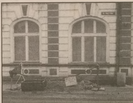
To ta rozrębana dziura

Znane jest miejsce wydobywania się gazu na powierzchnię, natomiast nie