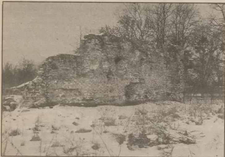
Ruiny zamku Sędziwoja Pałuki w Szubinie, stan obecny