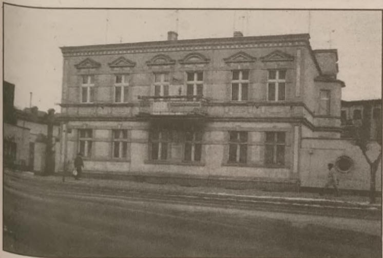
Budynek przy ulicy Mickiewicza 4

Budynek przy ulicy Mickiewicza 4 należał do nie istniejącego już Żefamu. Sześć rodzin tam mieszkających uiszczalo wszelkie opłaty (czynsz, prąd, opłata za garaż, itd.) w Żefamie i tam