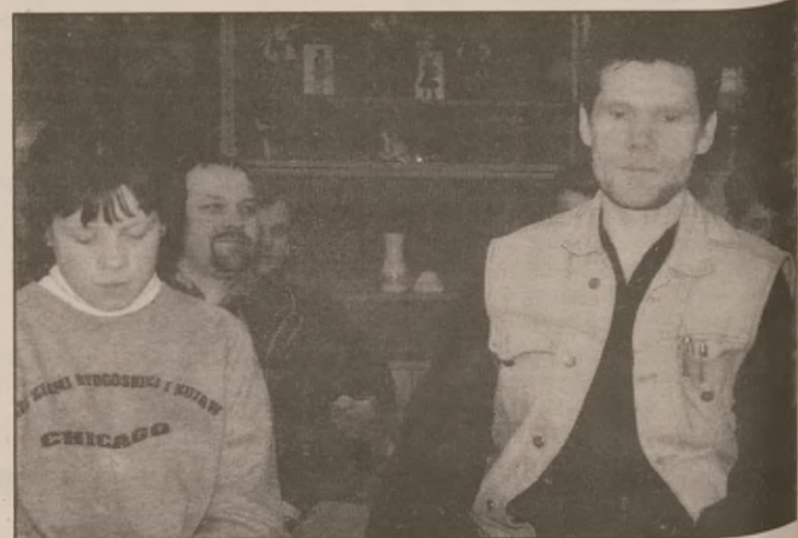
Grupa buddyjska podczas wykładu

fakt, że istnieje tyle cierpienia, świadczy o tym, że my niewłaściwie na tę rzeczywistość patrzymy i dlatego też cierpimy. Medytacja uczy nas tego właściwego patrzenia.