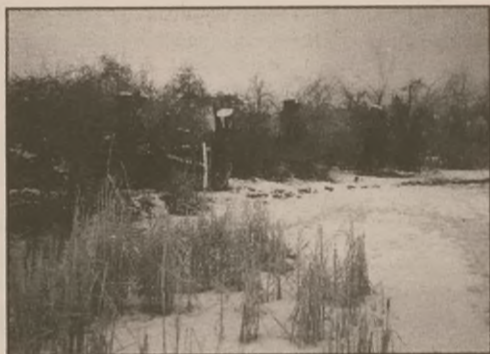
Drzewa ścięto na wysokości 2-2,5 metra nad ziemią.

Na obszarze od "budki rybaka", znajdującej się nad Jeziorem Czaplęm ze Liceum Ogólnokształcącym w Żninie, w kierunku ul. Szpitalnej wycięto nielegalnie dziewięć niedużych drzew. Straż Miejska ujawniła ten fakt w lutym. Sprawcy (sprawców) nie udało się jednak ustalić, nie znalazł się też nikt kto by to zdarzenie widział. Jednak niewielka średnica pni wyciętych wskazuje na to, iż mogły one nadać się tylko na opał.