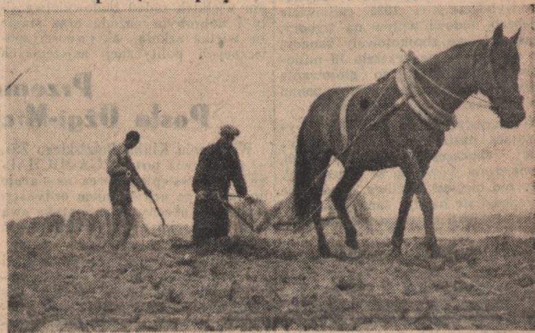
Jednym z ważniejszych zabiegów agrotechnicznych, podnoszących urodzaj są podorywki.

Zrozumieli to już chłopi gospodarujący indywidualnie. Obserwacje prac w gospodarstwach zespołowych: PGR-ach i spółdzielniach produkcyjnych przekonały ich o skuteczności zabiegów agrotechnicznych stosowanych przez te gospodarstwa.