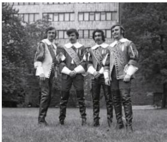
Trubadurzy.