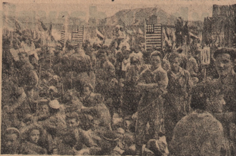
Młodzi rzemieślnicy Wybrzeża wśród stoczniovców gdańskich na Zlocie Młodych Przdowników Budowniczych Polski Ludowej. Zdjęcie wykonane w ramach zobowiązań przedzłotowych przez ucznia Rzemieślniczego Edwarda Gutę, zaś prace techniczne wykonał jego mistrz Jan Ostrowski z Gdańska-Wrzeszcza. Na dalszym planie ilustracji widoczne elementy szopki politycznej, z którą młodzież gdańska wystąpiła podczas pochodu złotowego.