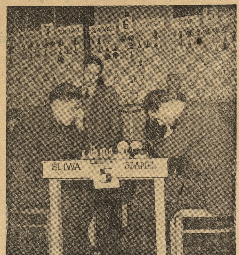
Po 16 rundach rozegranych Szachowych Mistrzostw Polski w Katowicach prowadzi Śliwa 12,5 pkt. przed Szapiel — 11 pkt. i Makarczykiem 10,5 pkt.