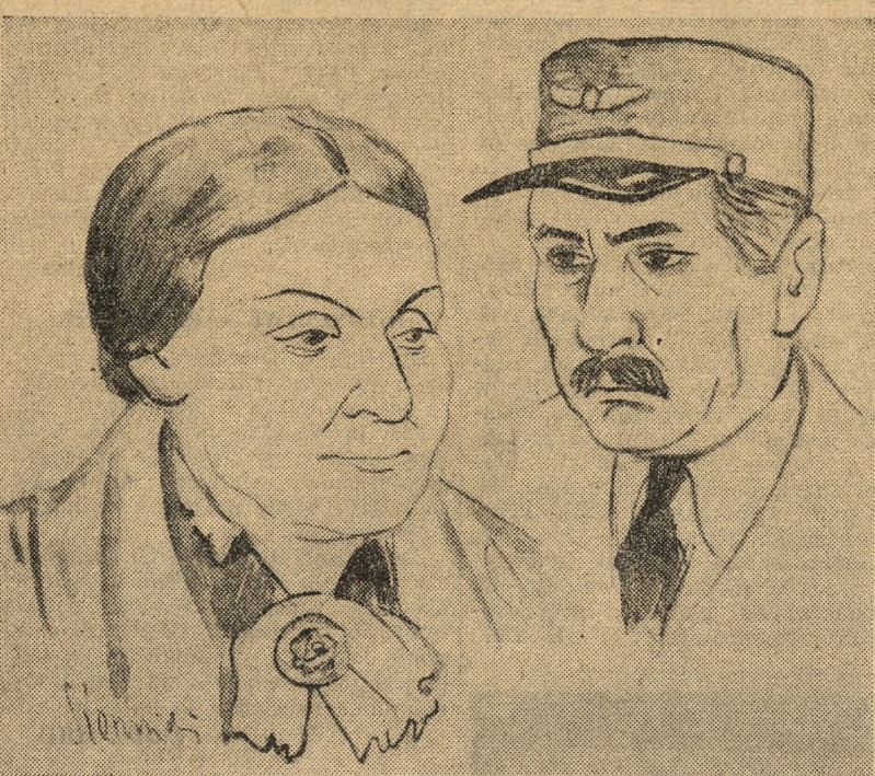
Dzisiaj, dnia 30 października br. wchodzi ponownie na afisz Państwowego Teatru Ziemi Pomorskiej sztuka K. Gruszczyńskiego pt. „Pociąg do Marsylii”.

Plan we wrześniu został po raz pierwszy w tym roku przekroczony. W październiku krzywa produkcji systematycznie rośnie.