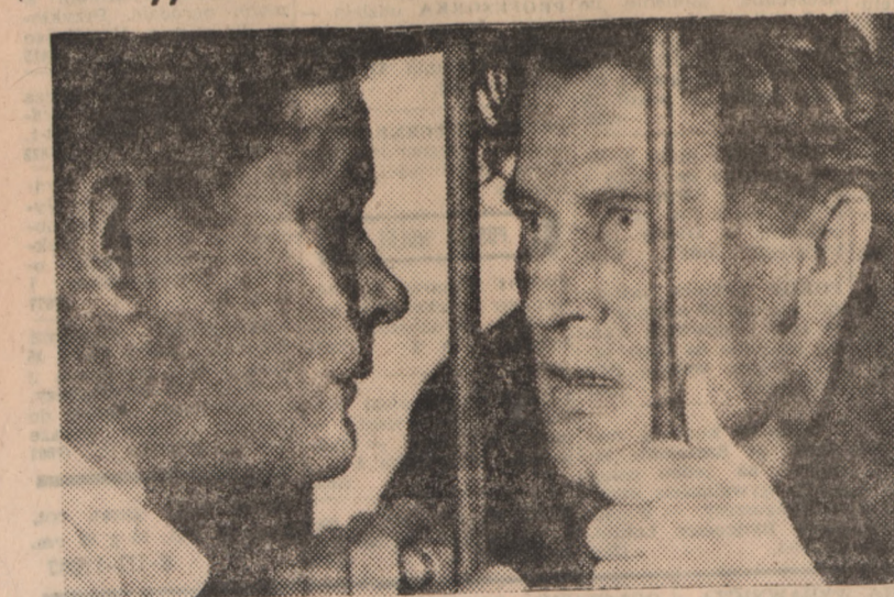
Dziś w ramach Dni Filmu Polskiego na ekranie kina „Pomorzanin” wyświetlany będzie film pt. „Czarci żleb”. Film ten, nakreślony według scenariusza i reżyserii Tadeusza Kańskiego i Włocha — Aldo Vergano.