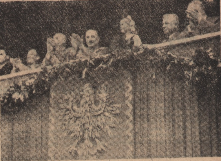
W dniu 7 września br. chłopi pracujący z całej Polski reprezentowani przez sto tysięcy delegatów, obchodzili ogólnokrajowe dożynki w Krakowie.