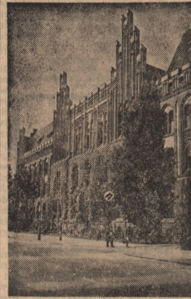
Gmach Poczty Głównej w Szczecinie

Organizatorzy Kongresu postarali się o piękną oprawę dekoracyjną sali. Nie będę powtarzał szczegółów