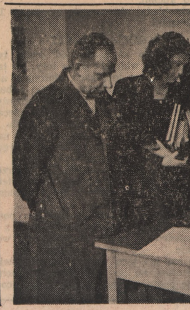
(Ciąg dalszy na str. 2)

Wraz z premierem Czou En-Laiem powrócili z Moskwy zastępca premiera Państwowej Rady Administracyjnej Czen Jun, zastępca szefa sztabu generalnego ludowo-rewolucyjnej rady wojennej Su Jui, minister przemysłu ciężkiego Wan Hao-Szou, zastępca dowódcy marynarki wojennej Chińskiej Republiki Ludowej Lo Szun-Czu, naczelnik wydziału ZSRR i krajów Europy Wschodniej w MSZ Chińskiej Republiki Ludowej Siui Yi-Sin, naczelnik wydziału azjatyckiego w MSZ Chińskiej Republiki Ludowej Czen Czian-Kan.