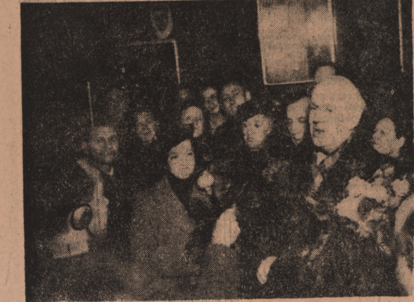
Na zdjęciu: Kierownik artystyczny i główny reżyser Teatru im. Mossowieta, ludowy artysta ZSRR, laureat Nagrody Stalinowskiej — Jurij Zawadzki dziękuje za serdeczne przywitanie.

W związku z Miesiącem Pogłębienia Przyjaźni Polsko-Radzieckiej przybył do Warszawy 155 osobowy zespół Państwowego Dramatycznego Teatru im. Mossowieta, odznaczony Orderem Czerwonego Sztandaru Pracy.