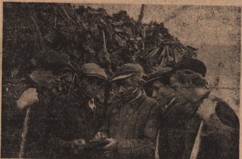
Członkowie spółdzielni produkcyjnej z Wilanowa w województwie opolskim dbając o stały rozwój spółdzielczej hodowli bydła przygotowują na zimę kiszonki z liści buraków cukrowych. Na zdjęciu: Spółdzielca brygada polowa Stanisława Robaka omawia plan wózki liści buraczanych