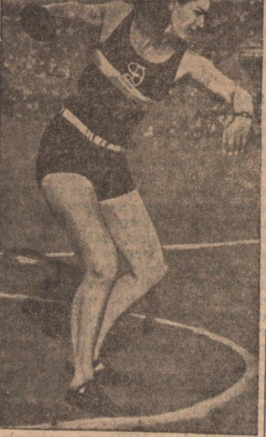
NINA DUMBADZE rekordzistka świata

W Związku Radzieckim miliony ludzi z miast i wsi uprawiają sport. Każdego roku w szeregi zrzeszeń sportowych wstępuje dziesiątki tysięcy chłopców i dziewcząt. W 1952 r. w zakładach pracy, kołchozach i sowchozach powstało tysiące nowych kół sportowych, wybudowano liczne nowe stadiony, pływalnie, lodowiska. Do dalszych postępów sportowców radzieckich przyczyni się nowa klasyfikacja sportowa, która wejdzie w życie z dniem 1 stycznia 1953 roku.