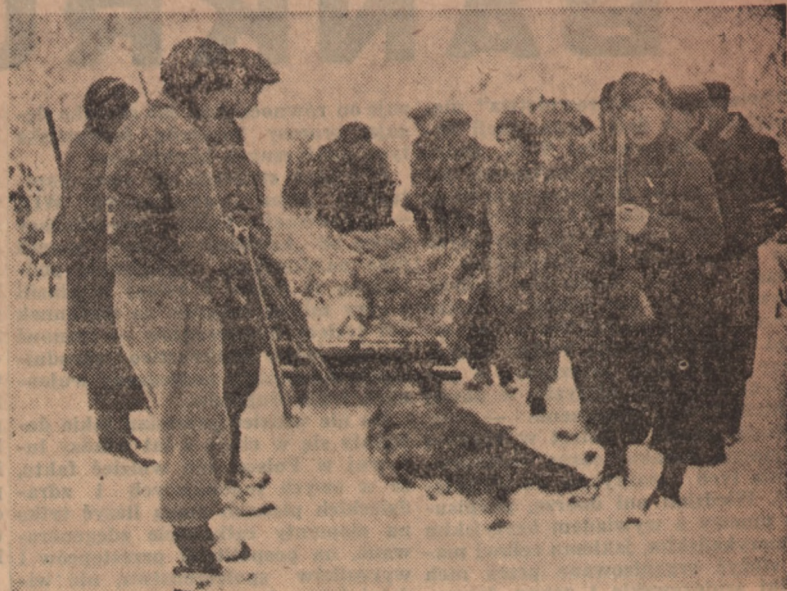
W lasach opinogórskich — stanowiących własność Polskiego Związku Łowieckiego, odbyło się inauguracyjne polowanie. Na zdjęciu: Myśliwi z upolowaną zwierzyną.