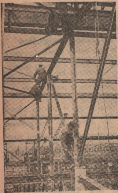
Budowa nowej huty