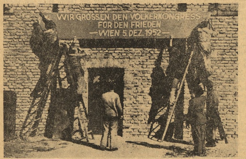
W Austrii przygotowania do Kongresu Narodów w Obronie Pokoju przybierają na sile. Na ulicach miast i w zakładach pracy pojawiają się liczne transparenty i afisze pozdrawiające Kongres Narodów. Na zdjęciu: Nad wejściem do zakładów naprawczych lokomotyw robotnicy umieszczają transparent witający Kongres Narodów w Obronie Pokoju.

Dziennik „Avgi” zamieścił pismo po witanie kobiet greckich — matek, żon i sióstr więźniów politycznych do Kongresu Narodów w Obronie Pokoju. Pismo to głosi m. in.: „My, kobiety greckie, z całego serca pragniemy pokoju i walczymy o odpedzenie widma wojny. Wiemy, czym grozi nowa wojna naszym krajowi. Jednocześnie kobiety greckie apelują do Kongresu, by przyczynił się do przywrócenia wolności w ich kraju i do zwolnienia licznych greckich więźniów politycznych.