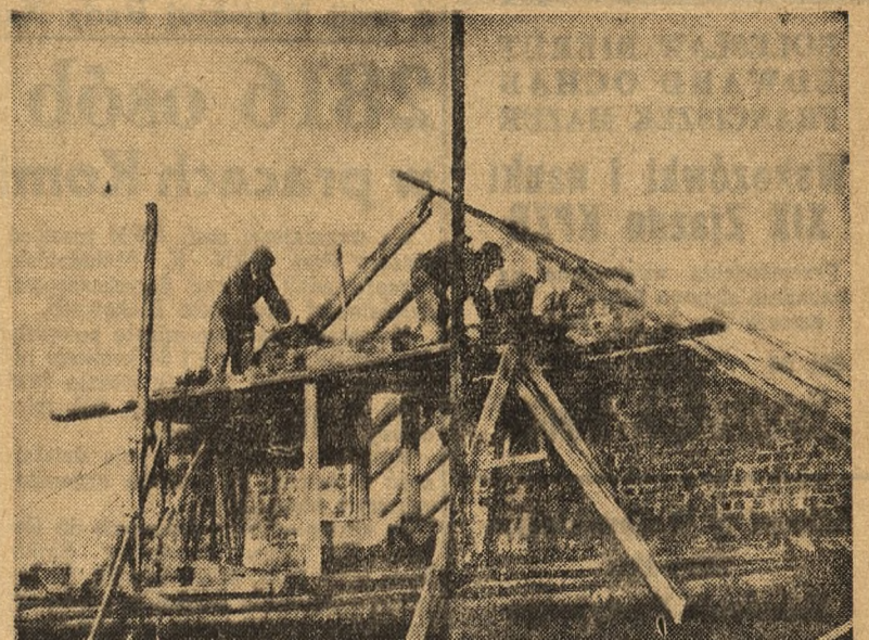
Warunkiem wzrostu towarowości produkcji hodowlanej w Państwowych Gospodarstwach Rolnych jest zapewnienie trwałej bazy paszowej, poprawa jakości bydła i trzody oraz zapewnienie dobrych zabudowań gospodarczych. Na zdjęciu: Budowa chlewni w PGR Dzieżki w woj. olsztyńskim.

Rozbudowa Państwowych Gospodarstw Rolnych