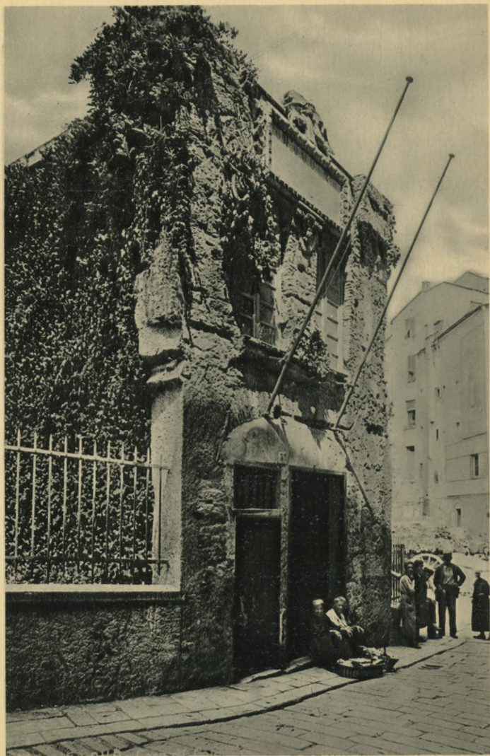
GENOVA - Casa di Cristoforo Colombo