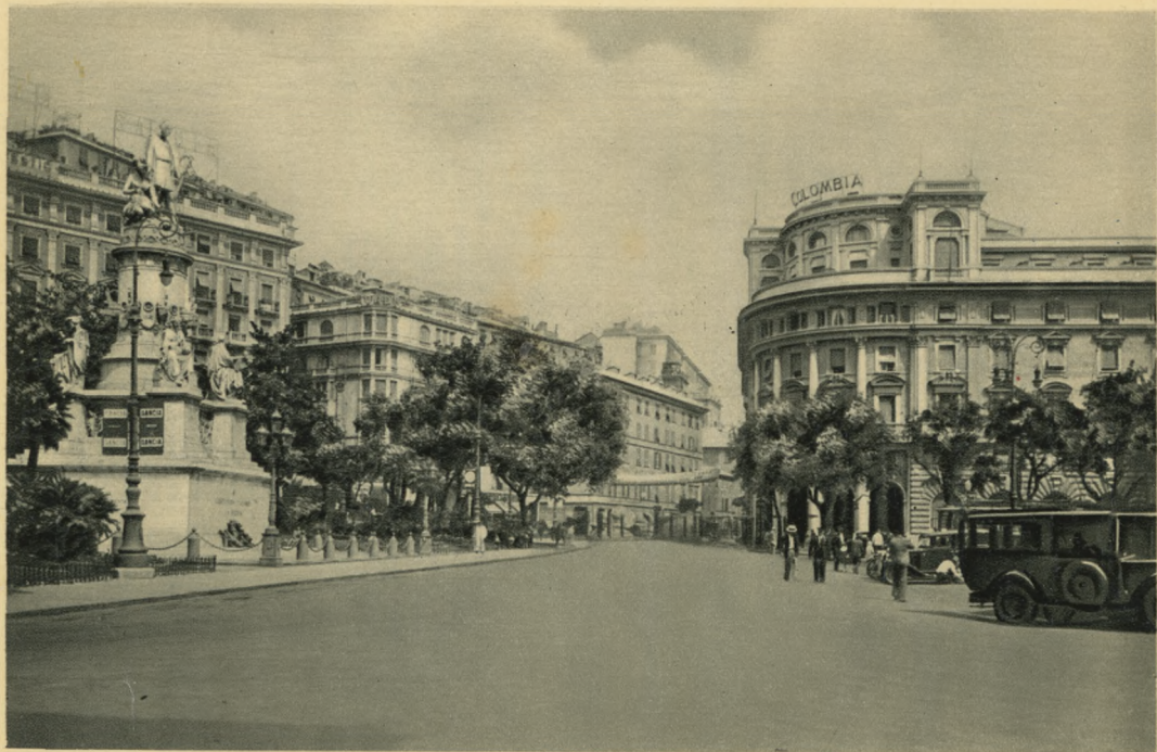
GENOVA - Monumento a Cristoforo Colombo - Piazza Acquaverde