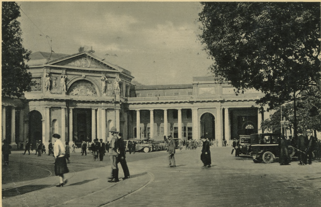
GENOVA - Stazione Principe