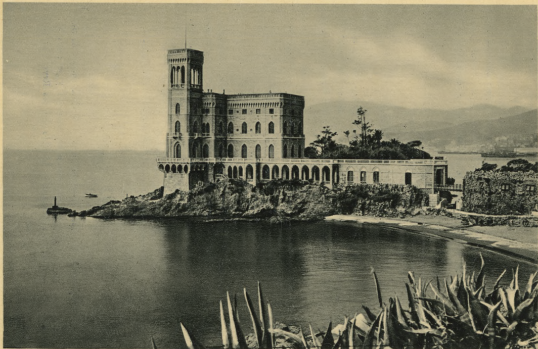
GENOVA - Cornigliano - Castello Raggio