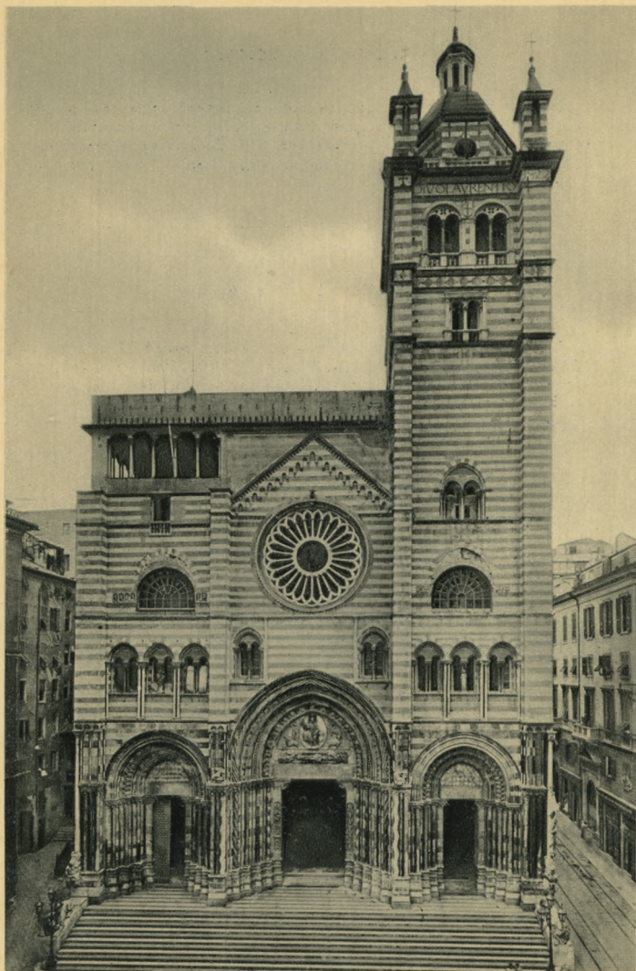
GENOVA - Chiesa di S. Lorenzo