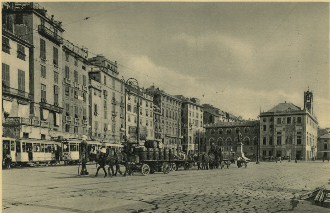
GENOVA - Piazza Caricamento