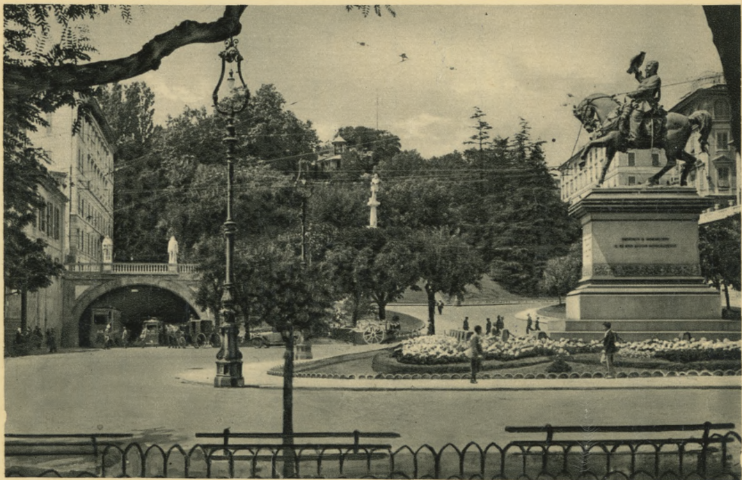
GENOVA - Piazza Corvetto