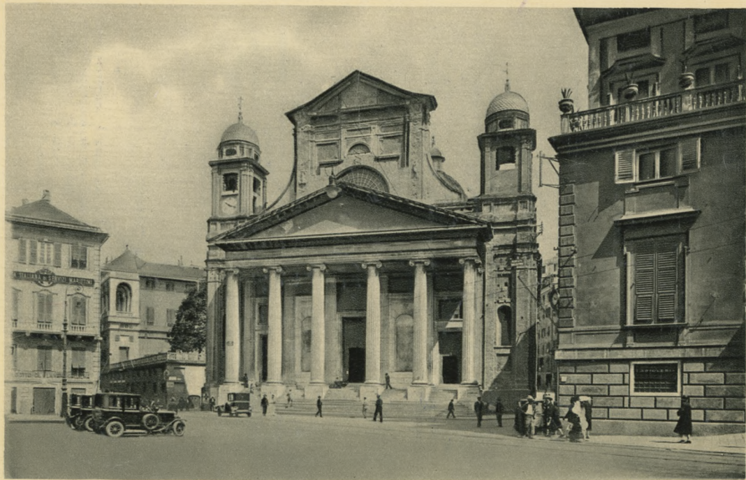
GENOVA - Chiesa SS. Annunziata