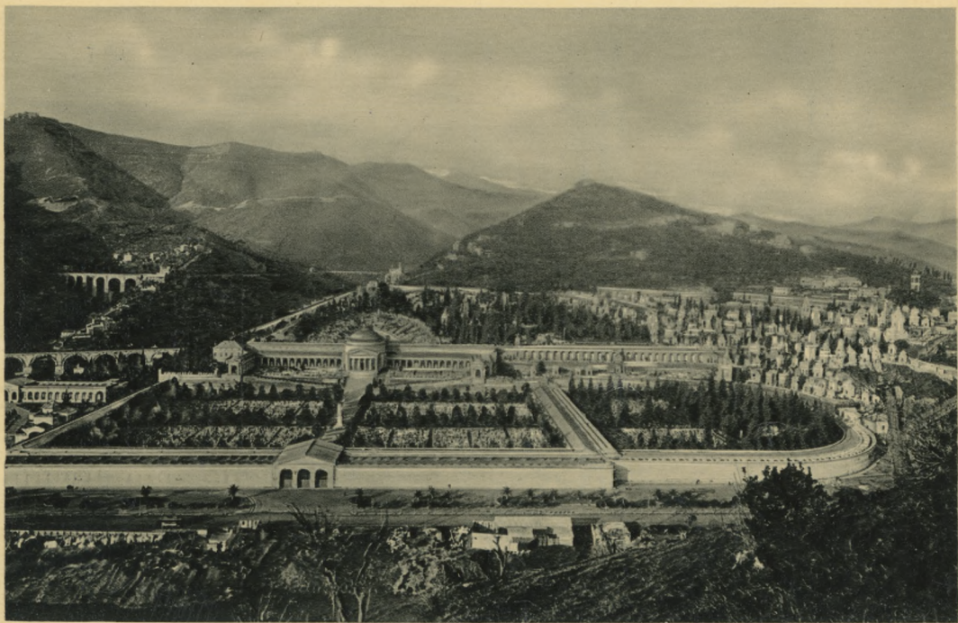
GENOVA - Panorama Cimitero di Staglieno