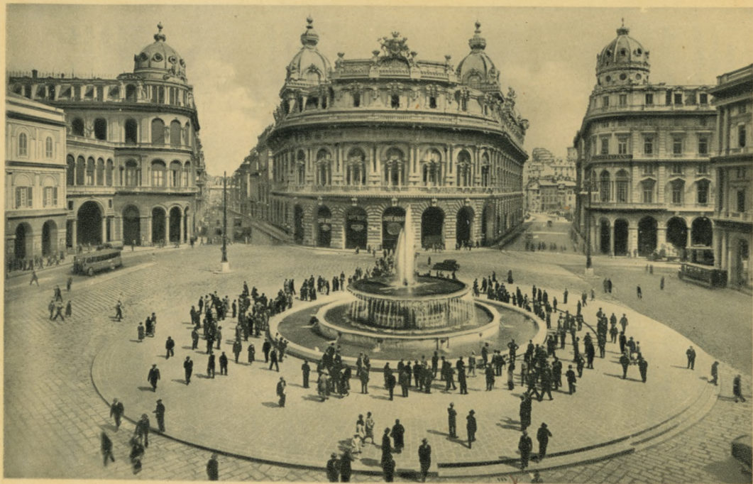
GENOVA - Piazza De Ferrari