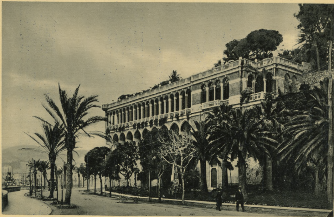
GENOVA - Circonvallazione a Mare