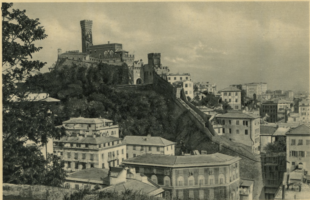
GENOVA - Castello De Albertis