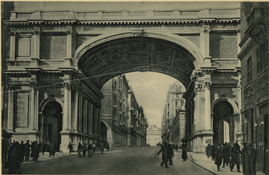
GENOVA - Via XX Settembre