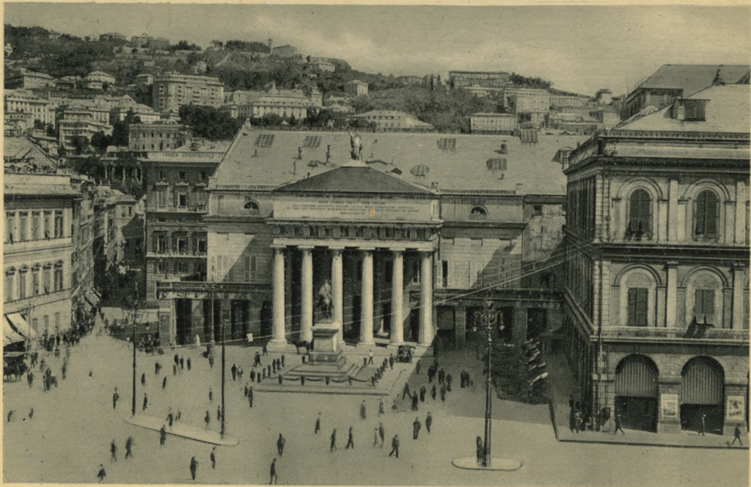
GENOVA - Teatro Carlo Felice