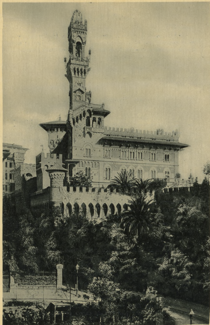
GENOVA - Castello Mackenzie