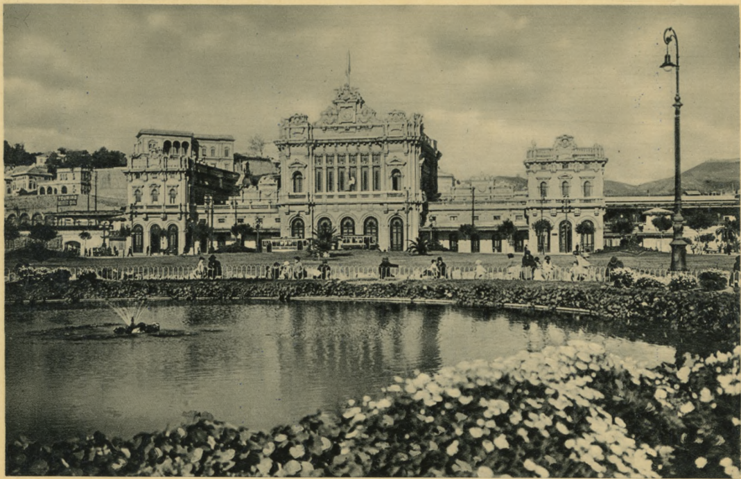
GENOVA -- Stazione Brignole