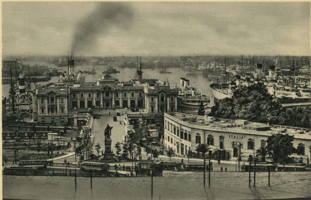
GENOVA - Stazione Marittima