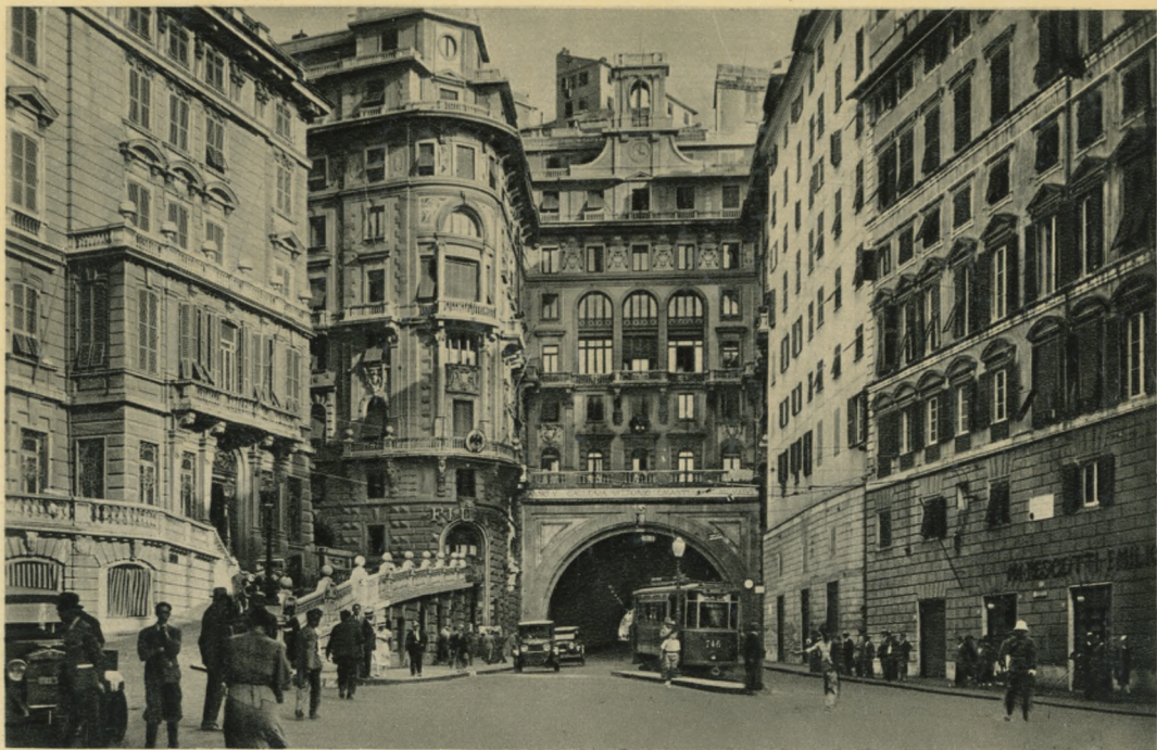
GENOVA - Galleria Vittorio Emanuele III - Piazza Corridoni