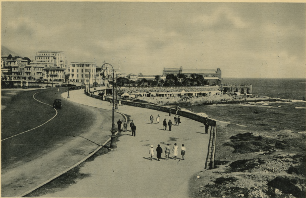
GENOVA - Lido d'Albaro