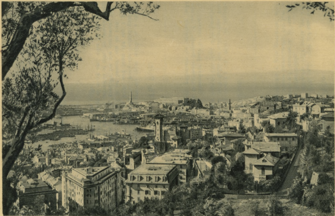
GENOVA - La Lanterna e il Porto