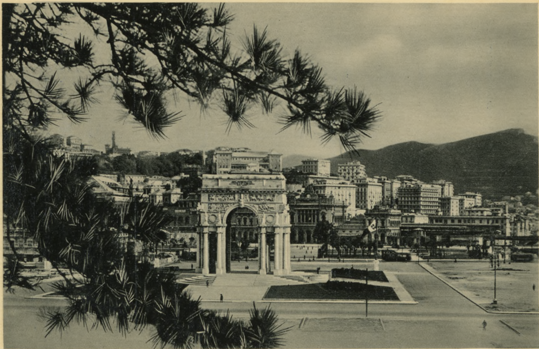
GENOVA - Monumento ai Caduti