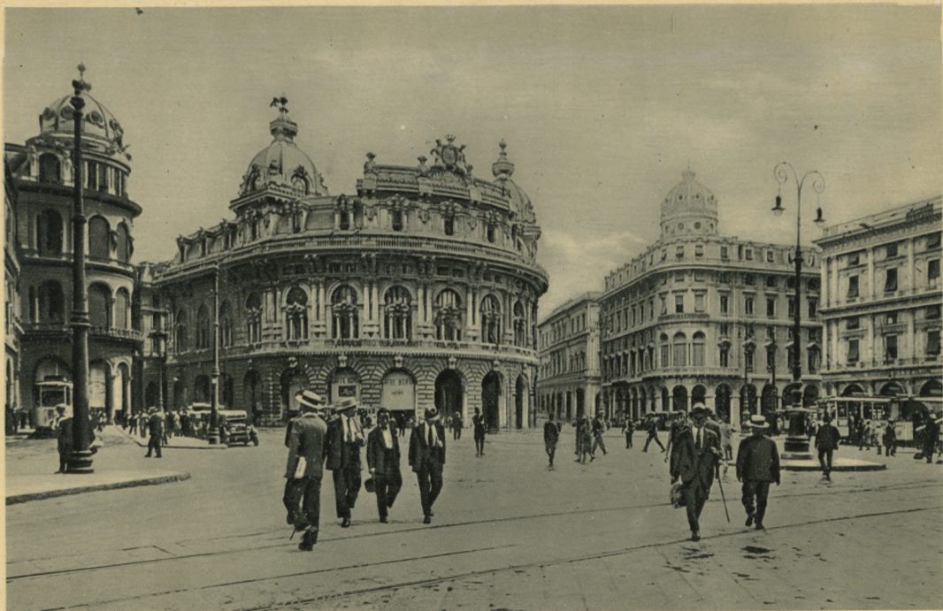
GENOVA - Piazza De Ferrari - Palazzo della Borsa