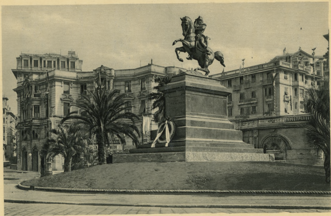
GENOVA - Monumento al General Belgrano