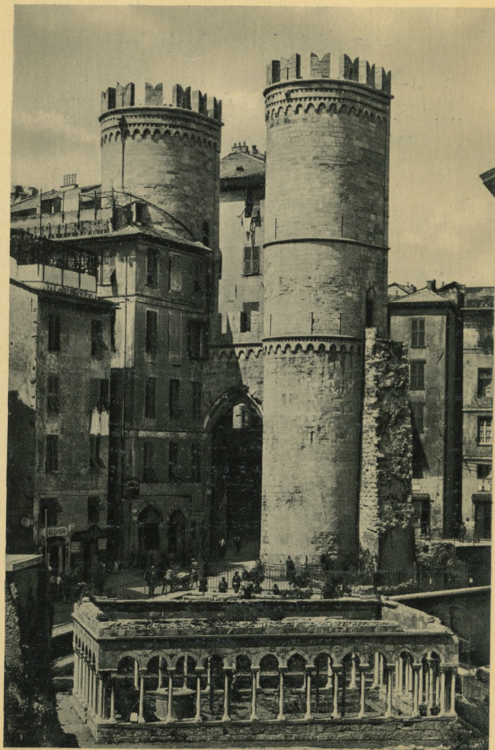
GENOVA - Chiostro di S. Andrea - Le Torri