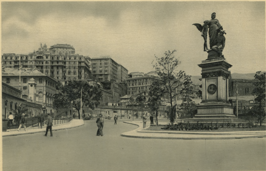
GENOVA - Monumento al Duca di Galliera