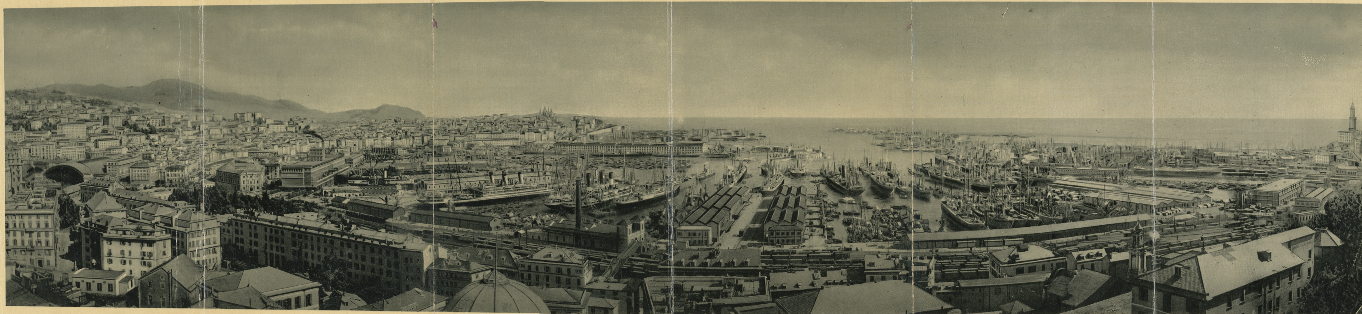
GENOVA - Veduta Generale e del Porto