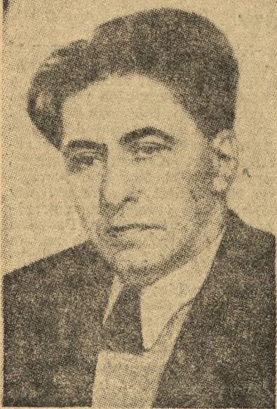
Ilya Erenburg (pisarz — ZSRR)

Laureaci Międzynarodowych Nagród Stalinowskich „Za utrwalanie pokoju między narodami“ na rok 1952