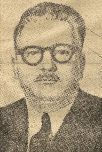
Yves Farge (Francja)