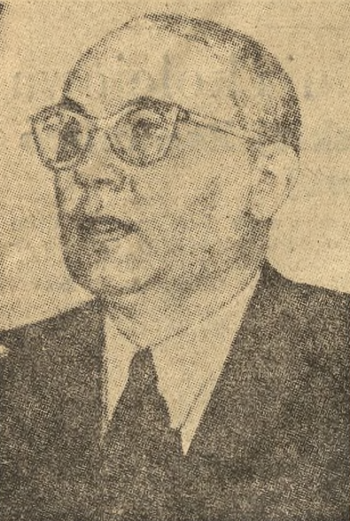
Johannes Becher (pisarz — Niemiecka Republika Demokratyczna)