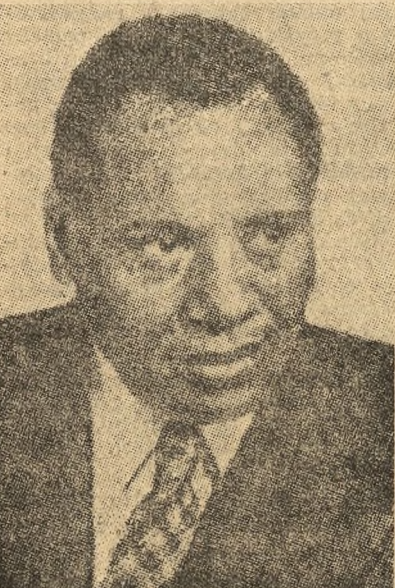
Paul Robeson (USA)