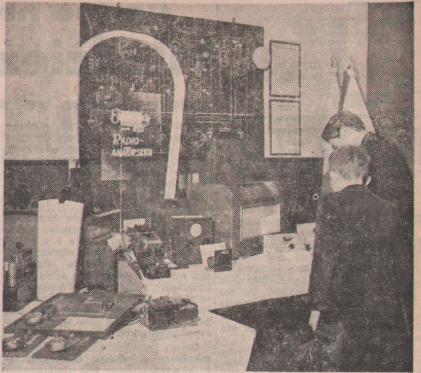
Zarząd Okręgu Społecznego Komitetu Radiofonizacji Kraju zorganizował w Poznaniu Wystawę Radiową, w której udział wzięły: Rozgłośnia Poznańska Polskiego Radia, Radiofonizacja Kraju, Sekcja Krótkofalowa Woj. Zarządu LPZ, Sekcja Radiotechniczna Młodzieżowego Domu Kultury oraz zakłady wola radioamatorskie z całego województwa. Wystawę zwiedziło około 10.000 osób.

Na zdjęciu: Stoisko kół radioamatorskich.