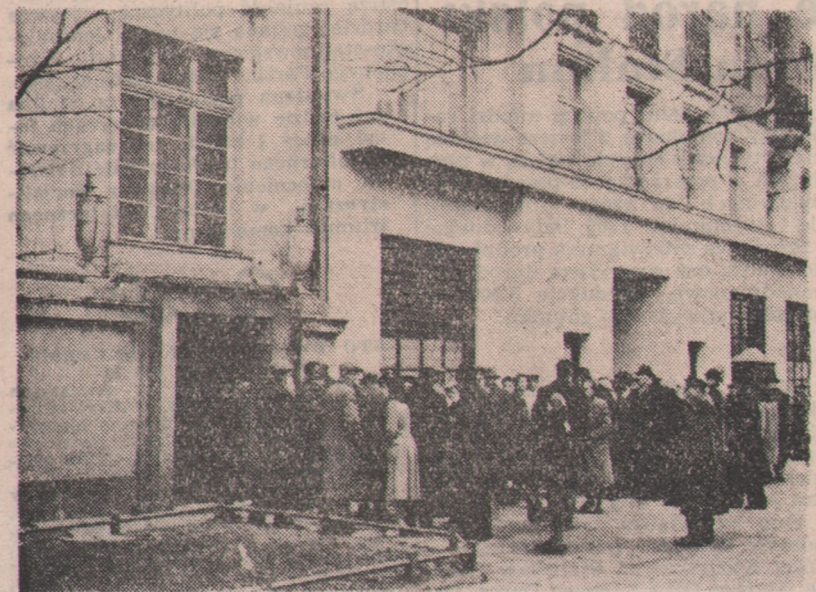
Do Ambasady ZSRR w Warszawie przybywają liczne delegacje społeczeństwa polskiego, aby na ręce Ambasadora ZSRR w Polsce A. Sobolewa złożyć wyrazy najgłębszego i serdecznego współczucia z powodu zgonu J. W. Stalina. Na zdjęciu: Delegacje przed gmachem Ambasady.

Cenne osiągnięcia naukowców Instytutu Odlewnictwa ma poważne znaczenie dla naszej gospodarki narodowej.