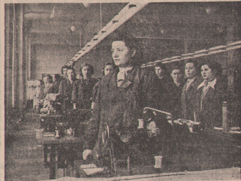
W dniu 9 marca br. w dniu żałoby narodowej o godz. 10 w chwili pogrzebu Wodza postępowej ludzkości Józefa Stalina, we wszystkich zakładach pracy, w przemyśle i rolnictwie, w urzędach i instytucjach, w szkołach i jednostkach wojskowych nastąpiła przerwa w pracy na 5 minut i uroczysta chwila skupienia.

Spotęgujemy więc dziesięciokrotnie nasze wysiłki, wzmocnimy czujność rewolucyjną, by jeszcze bardziej umocnić niezawisłą jedność wolnych narodów, wykuta i wypiastowana przez geniusz Wielkiego Stalina, który jest tak bliski i drogi wszystkim miłującym wolność, wielkim i małym narodom.