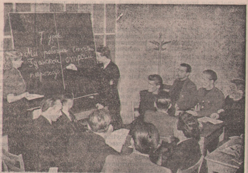
Robotniczy Dom Stocznowca nr 1 w Gdańsku - Wrzeszczu należy do wzorowych hoteli robotniczych na Wybrzeżu. W hotelu znajduje pomieszczenie około 300 robotników, którzy przybyli do pracy w stoczni z różnych stron Polski. Hotel zajmuje pierwsze miejsce w співzawodnictwie między hotelami Stoczni pod względem czystości i pracy wychowawczej. Nad życiem mieszkańców Domu Stocznowca, ich podstawą w pracy zawodowej i społecznej oraz warunkami bytowymi czuwa wybrana przez mieszkańców Rada, która dzieli się na szeregi sekcji. Wiceprezorem po pracy życie mieszkańców koncentruje się w świetlicy. Na zdjęciu: Kurs języka rosyjskiego zorganizowany w ramach własnych. Przewodniczącą jest kierowniczka młodzieżowej brigady im. Hiberna, która dla uczczenia pamięci J. W. Stalin postanowiła podnieść wydajność pracy średnio do 210 proc. normy.