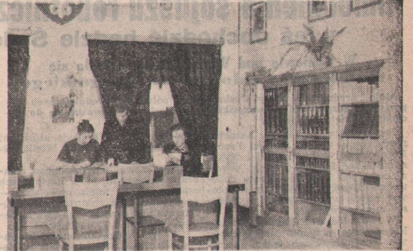
W ciszy i atmosferze skupienia, która panuje wszędzie tam, gdzie człowiek spotyka się z książką, upływają godziny pracy w Wojewódzkiej Bibliotece Publicznej w Olsztynie.

BERLIN (PAP). Agencja ADN donosi, że ludność Kassel zaprotestowała energicznie przeciwko zwołaniu do tego miasta na Zielone Święta zjazdu b. spadochroniarzy hitlerowskich, na którym miał przemawiać osławiony generał SS Ramcke.