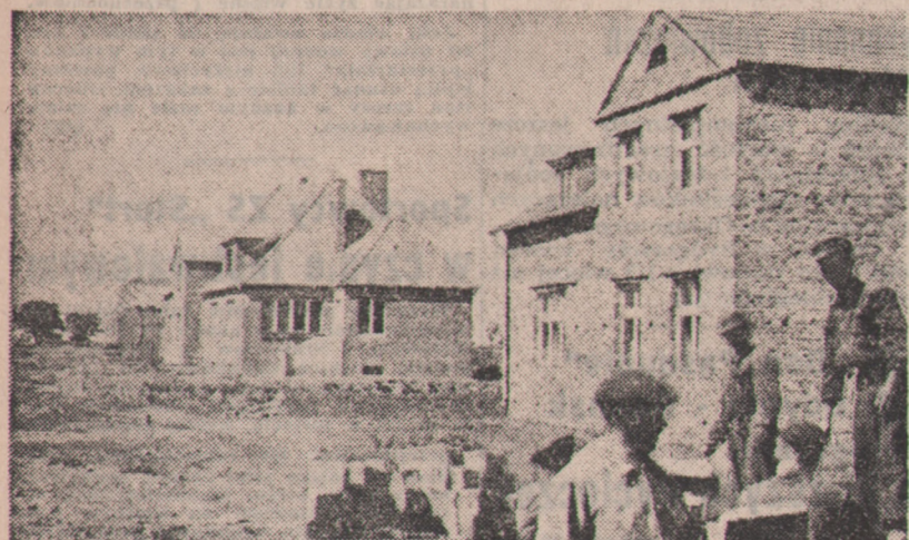
W Chojnicach, powstają całe nowe ulice z jednorodzinnych domków, które budują sobie ludzie pracy.