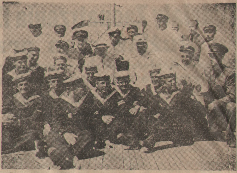
Prezes Rady Ministrów Bolesław Bierut i Marszałek Polski Rokossowski wśród marynarzy.