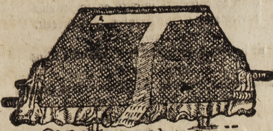
Joh ruhe sanft und selig.